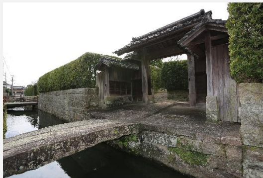
石橋・石垣・腕木門