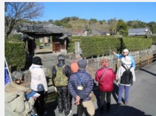
加世田麓まち歩き