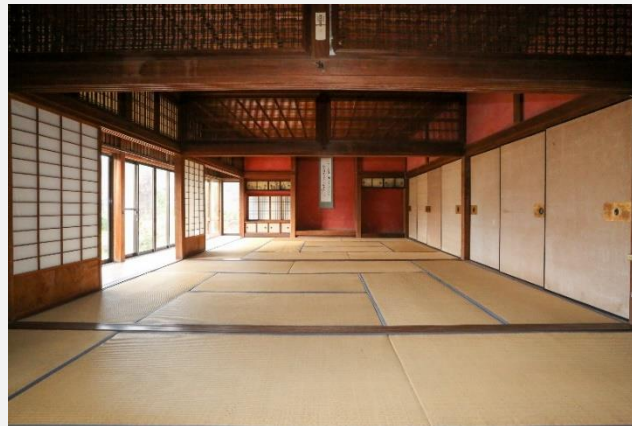
旧鯉坂家住宅の屋外・屋内意匠(赤壁・床・欄間) (国登録有形文化財)