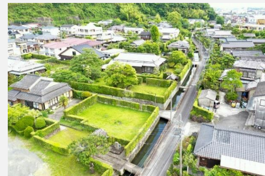
加世田麓の町並み

これらの風土を守り伝えてきた保存地区の住民、技術者・職人に、広く市民、NPO、各分野の学識経験者などが協力して、保存地区の伝統的建造物群及びこれらと一体をなす環境を「生きている町並み博物館」として保全に努める。