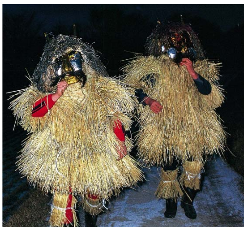
家へ向かうナマハゲ