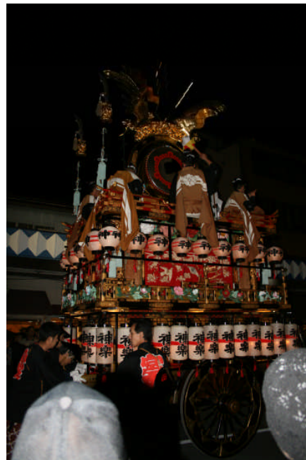
高山祭の屋台行事(秋)