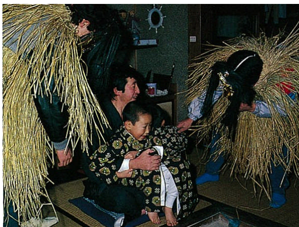
家を訪れるナマハゲ