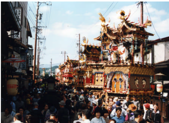
高山祭の屋台行事(春)