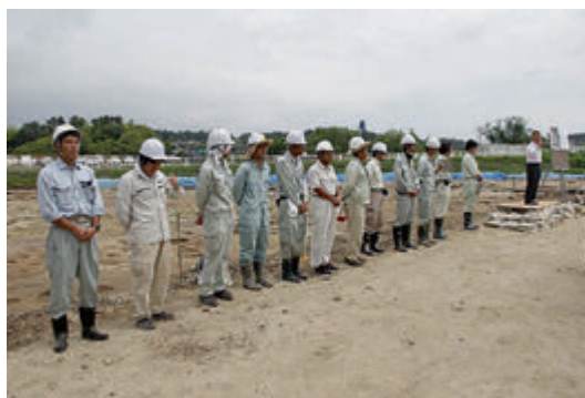
全国からの派遣職員の方々とともに