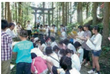
小学生対象のふるさと学習