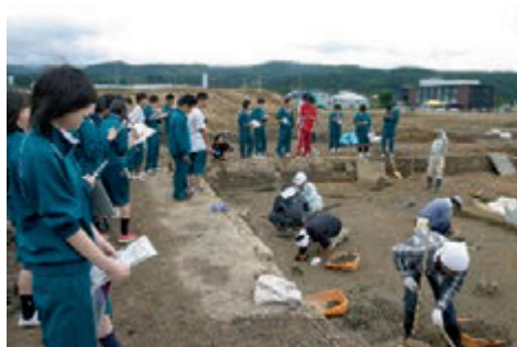
高校生対象の遺跡見学会