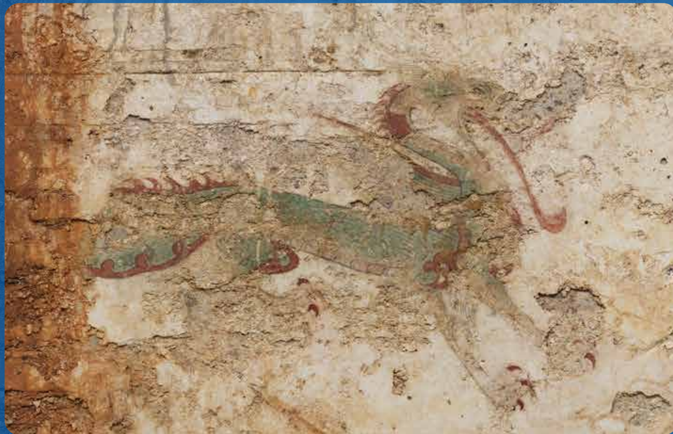
東壁青龍(令和4年2月撮影)

4月19日(火)~5月20日(金)の平日10時~16時。 公開期間中は8時30分から17時まで、無休で対応。