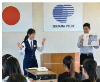
【警察署員による防犯講習】