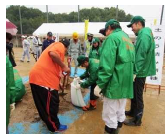
【防災訓練での土のう作り】