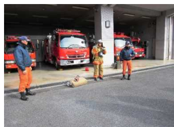
【消防署での消火訓練】