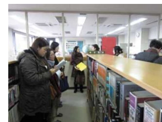
【図書館の利用講習】