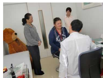
【病院での受診体験】