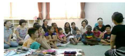
最後は、ママ達の言葉で絵本の読みきかせ