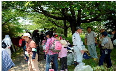
ボランティア体験（社会貢献）