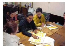
スリランカの絵本を使い自国の紹介