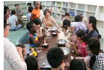
子どもたちは造形教室。後方はママ達