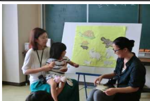
図書館での読みきかせ（中国語）