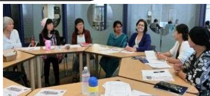
日本人グループと多言語おはなし会打ち合わせ