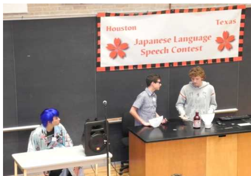
事業例①: 日本語スピーチコンテスト

在外公館では、日本の伝統文化から漫画・アニメ等ポップカルチャーに至る幅広い日本文化の紹介事業を実施。平成27年度には、日本語教育関係事業として、日本語学習者の学習意欲の維持・向上を目的にした「日本語弁論大会」等281件を実施。