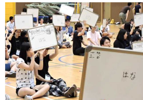
事業例③: 日本語クイズ大会