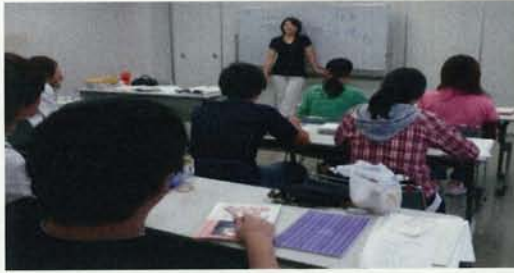
日本に来たばかりの生徒2人の個別授業