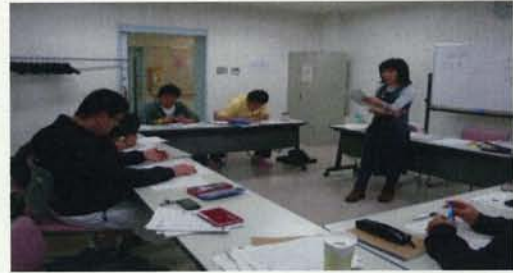
日本に来て1ヶ月程度の生徒のみんなの日本語10課の授業