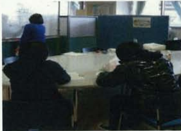
(2)8月27日 みんなの日本語36課～40課の復習テストを実施。