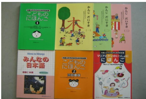
【補助教材 テキスト】