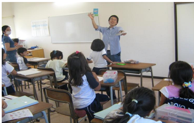
(基礎講座 北田先生)