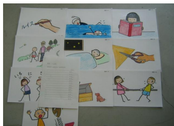
【補助教材・絵カード】