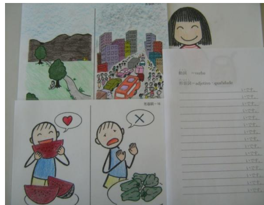
【補助教材 絵カード】