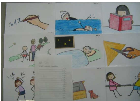
【補助教材・絵カード】