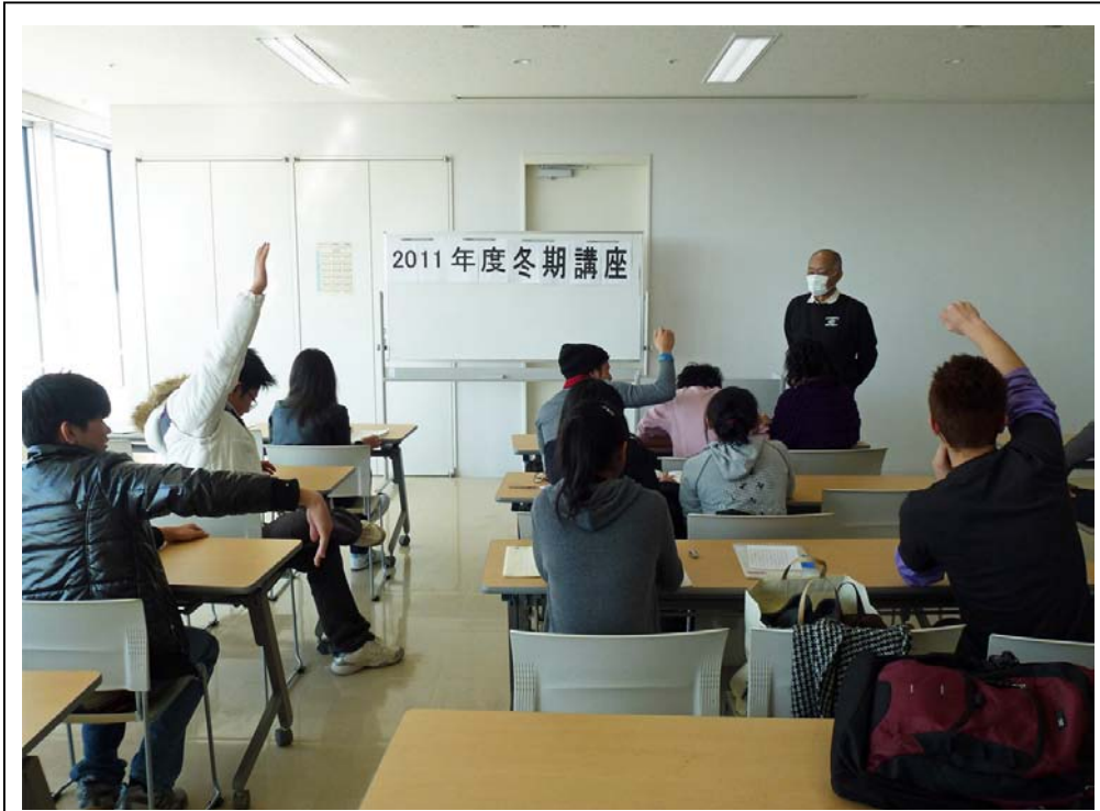
2012年 冬期講座 受験指導 模擬面接前の事前説明