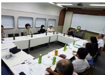
【写真】 第1回 運営委員会 2011/7/12