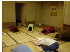
ヨガサークルの活動風景