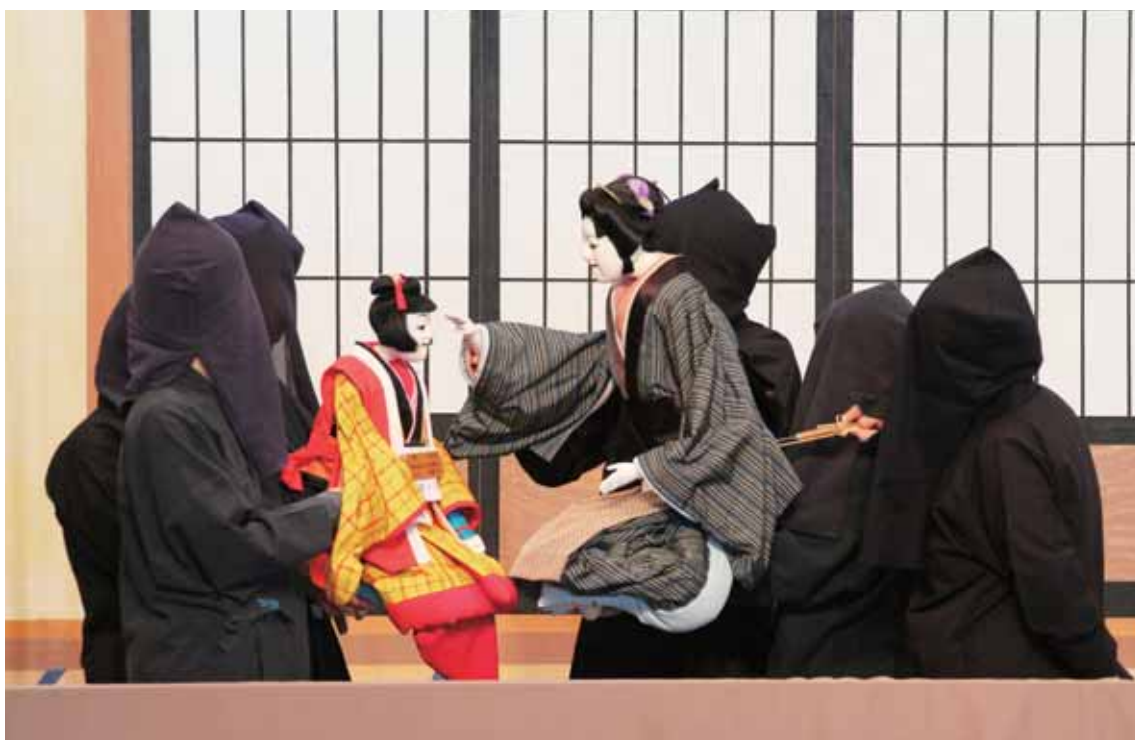
にんぎょうしばい み でこにんぎょう ばしょ 人形芝居が見られたり、木偶人形をかざったりしている場所。