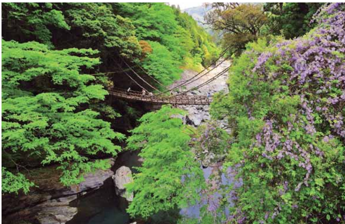
みよししにしい や やま そん や せい あ つく つ ばし に ほん さん だい き きょう 三好市西祖谷山村にある、野生のカズラを編んで作った吊り橋。日本三大奇橋のひとつ。