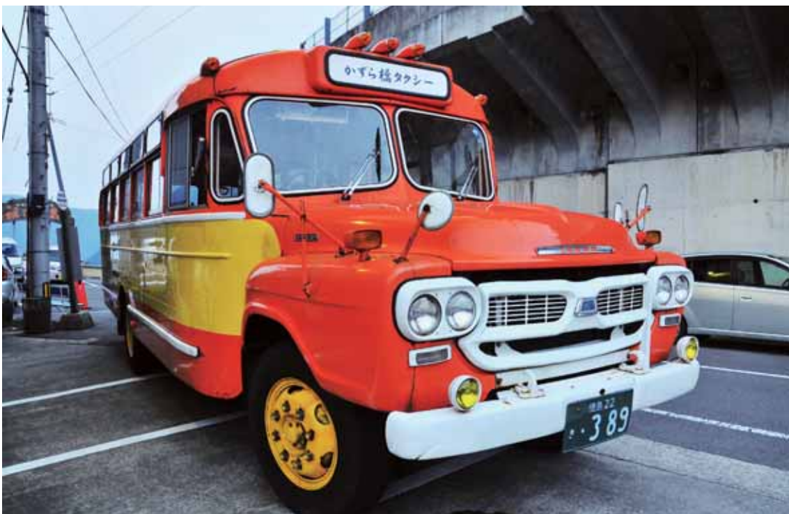
い や ちほう ていき かんこう 祖谷地方をめぐる定期観光バス。