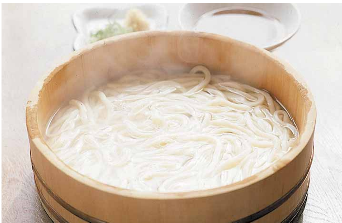
あわし きょうどりょうり 阿波市の郷土料理。