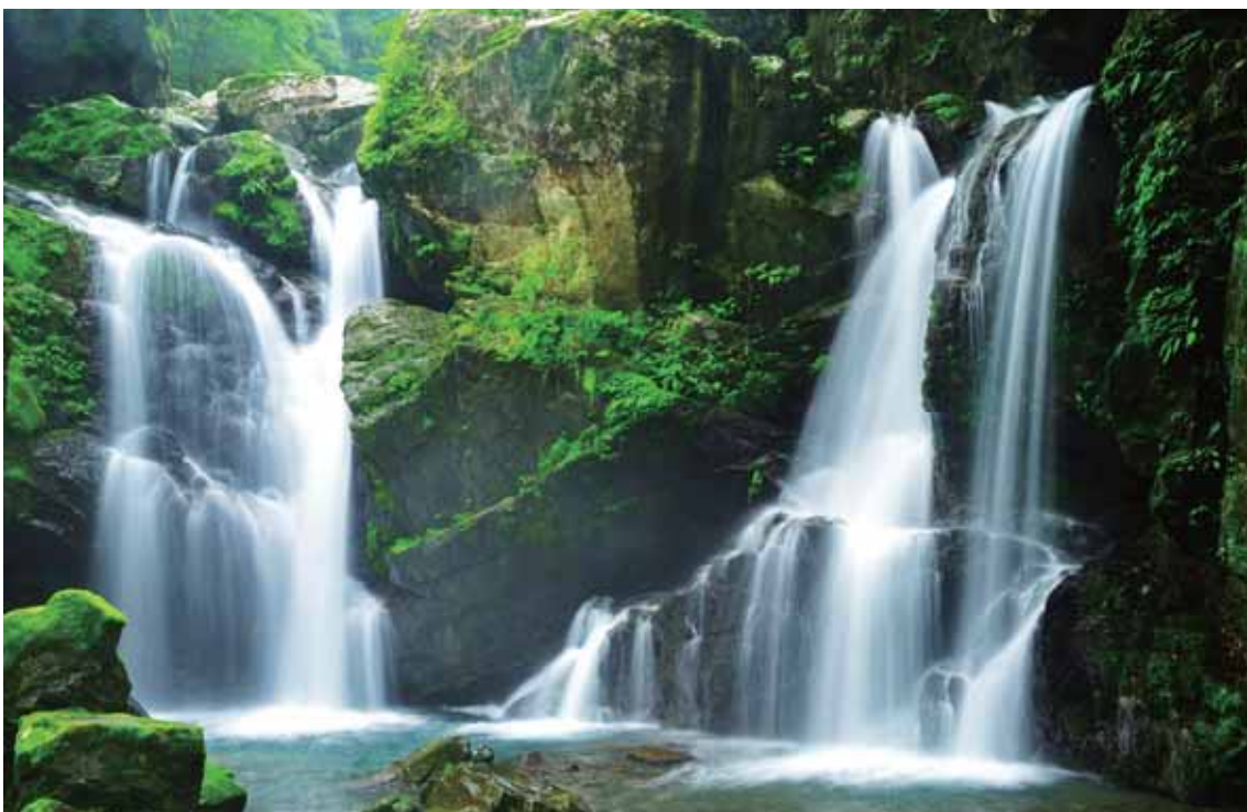
かいふ ぐんかいようちょう しこくさいだい たき 海部郡海陽町にある四国最大の滝。