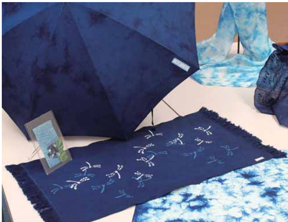
あいつかそめもの 藍を使って染めた染物。