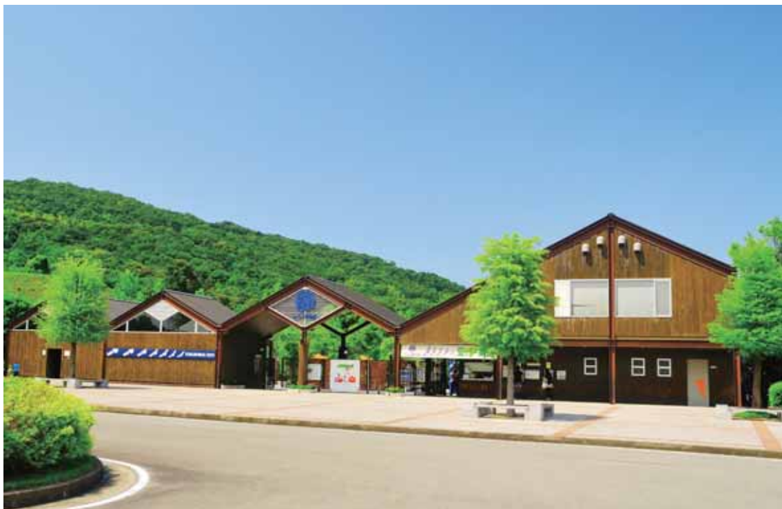
とくしまししがのちょう しゅるいやく 徳島市渋野町にある、80種類約400点の動物を飼っている動物園。 てん どうぶつ か どうぶつえん