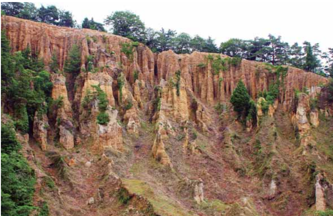
あわし につち はしら みる ぼしよ 阿波市にある、土が柱のように見える場所。