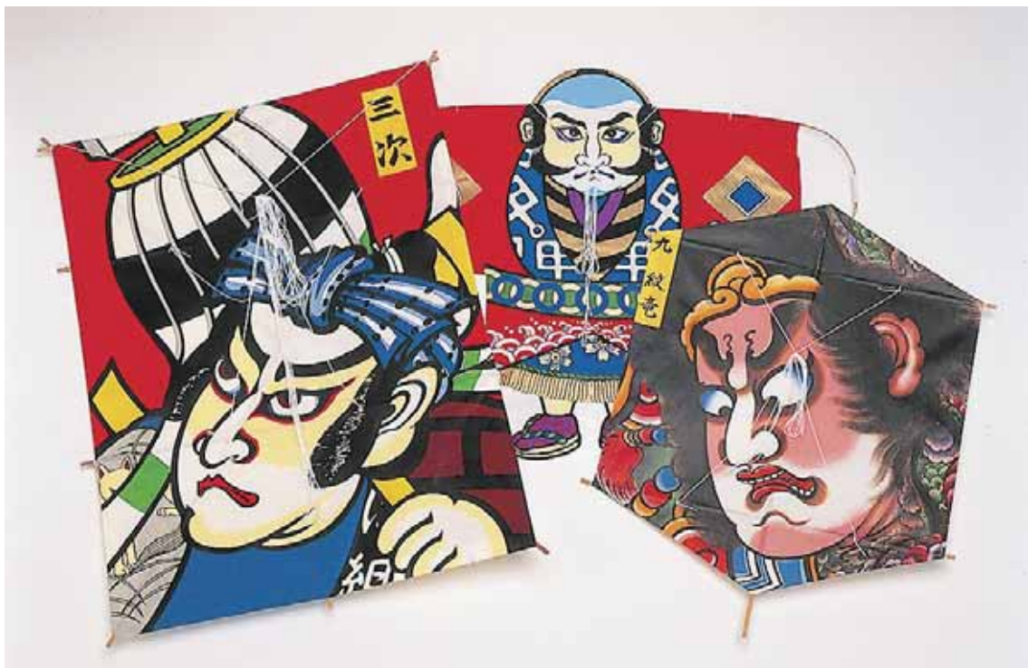
きもの そで さゆ う ひろ すがた つく たこ 着物の袖を左右に広げた姿に作った凧。