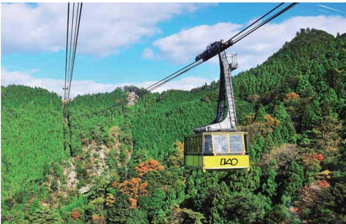
な かくん な ちよう わし さとえき あなんし たいりゅう じ えき むす 那賀郡那賀町の鷺の里駅と阿南市の太龍寺駅を結ぶロープウェイ。