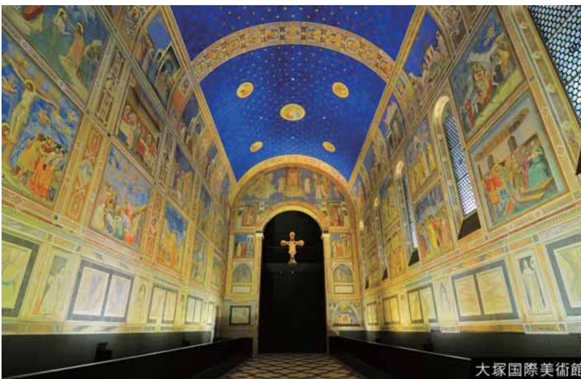
鳴門市にある、陶器でできた絵をかざっている美術館。