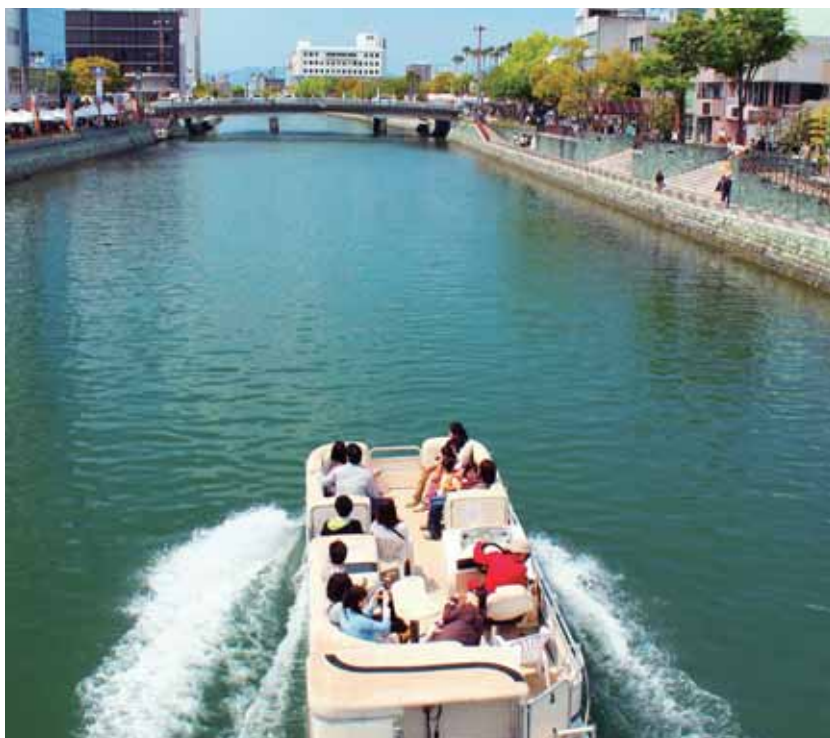
徳島市にあるひょうたん じま 島のまわりの景色 けしき を船 ふね に乗 の って楽 たの しむ。