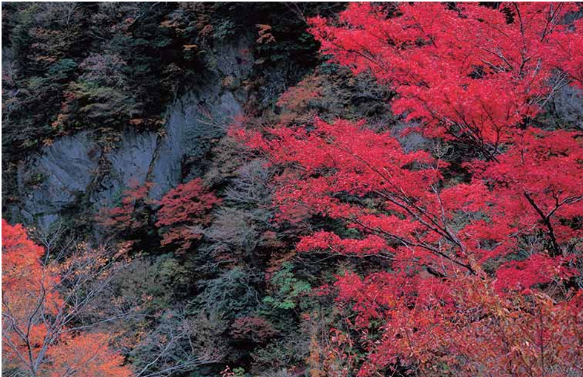
な かくん な か ちょう き とう きょうこく 那賀郡那賀町木頭にある峡谷。