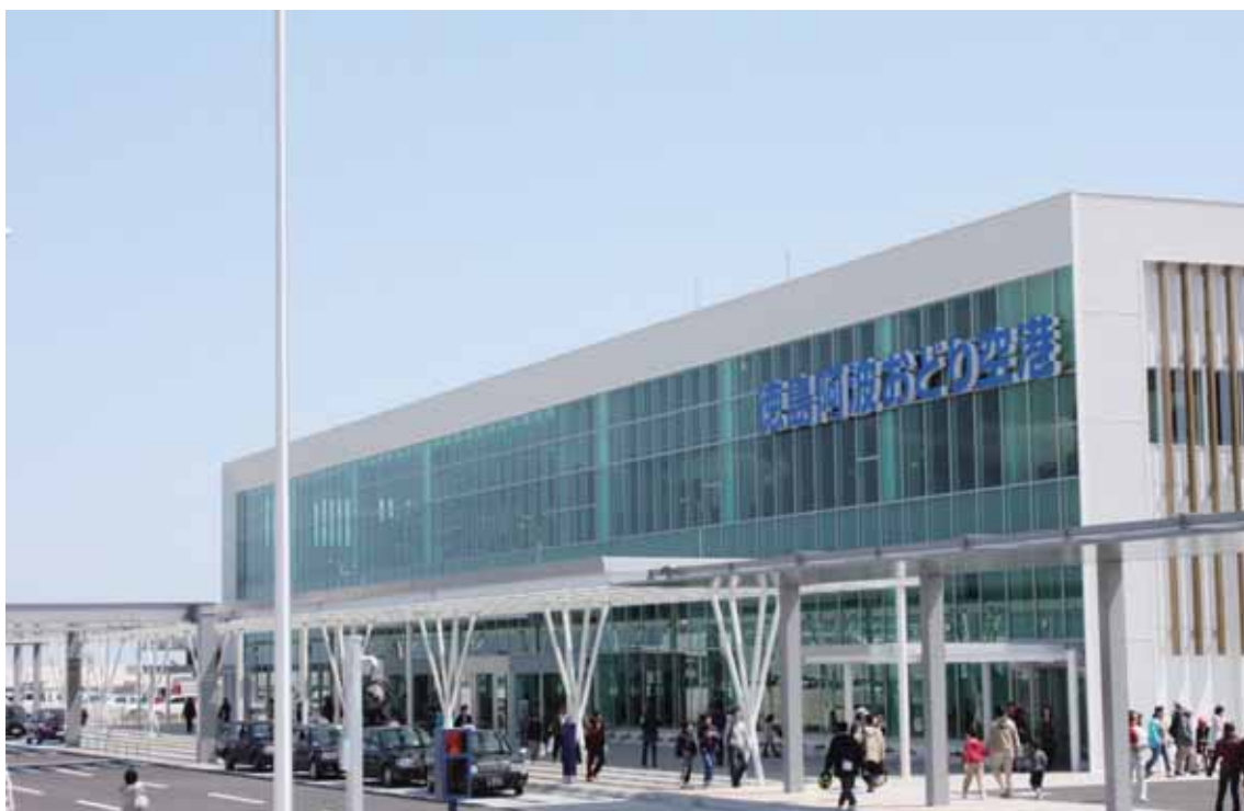
まつしげちょう ひ こうじょう 松茂町にある飛行場。