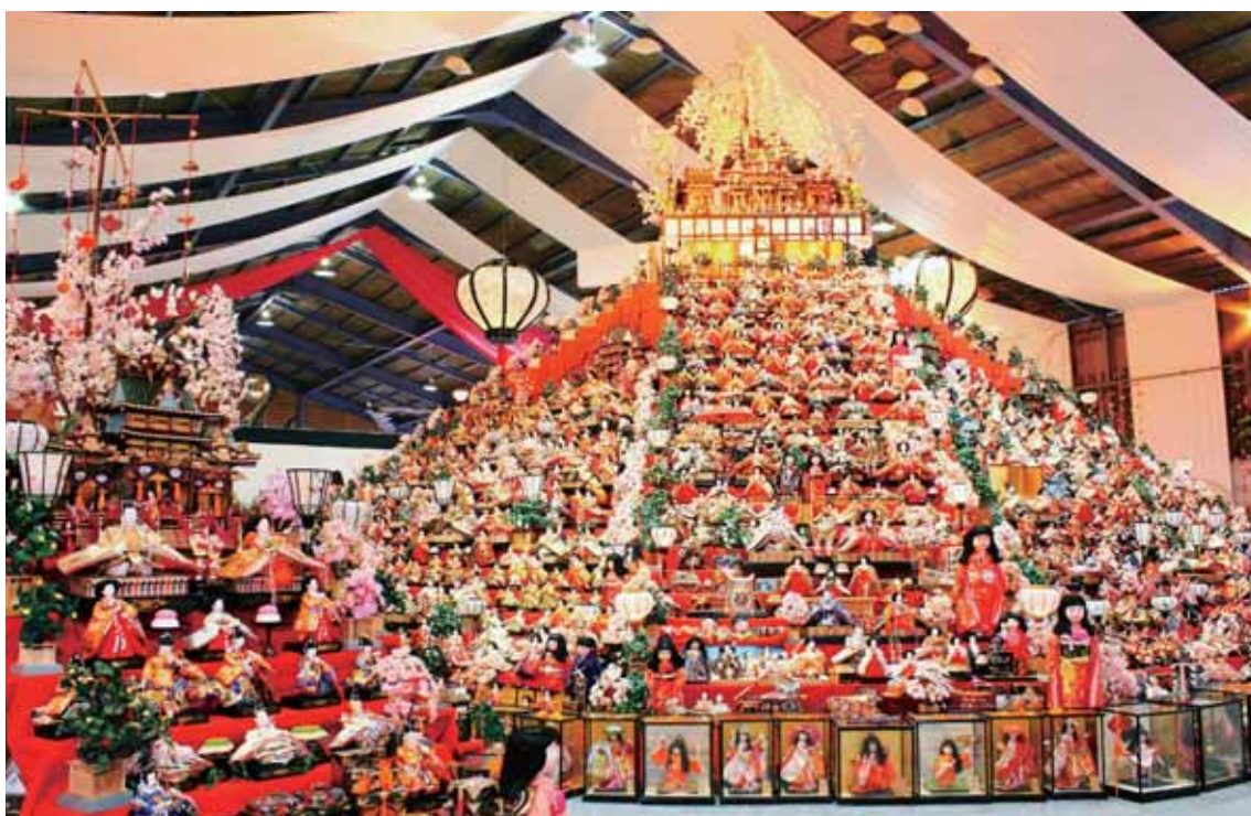
かつらぐんかつらちょう、まいとし がつ がつ かいさい まつり。勝浦郡勝浦町で、毎年2月から3月に開催されるひな祭り。