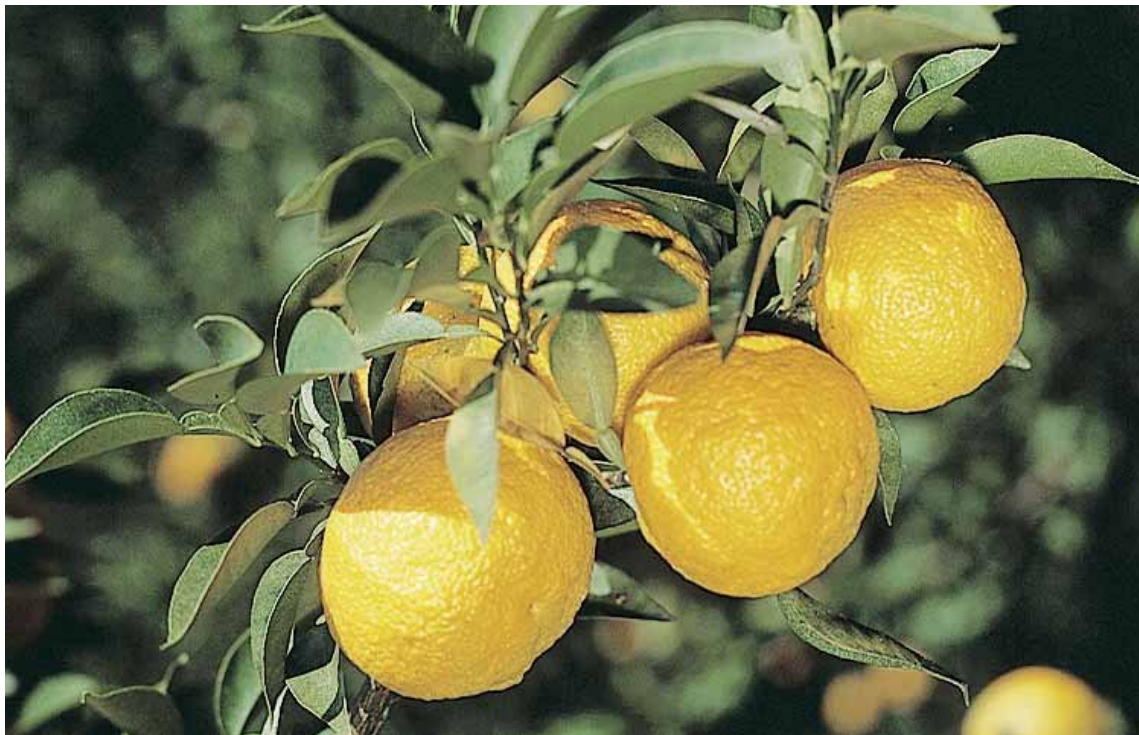
せいさんりょうぜんこくだい 生産量全国第2位。 いなかちょう 那賀町の「 きとう 木頭ゆず」が有名。 ゆうめい