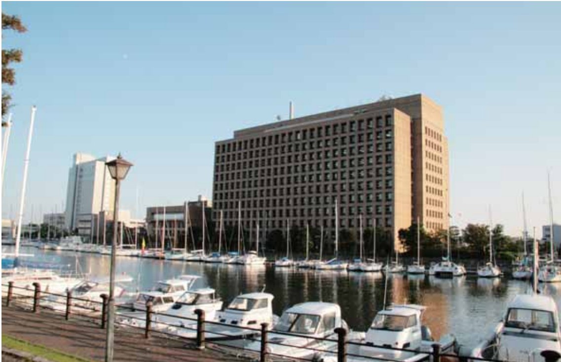
とくしまけん じむ おこな やくしよ 徳島県の事務を行う役所