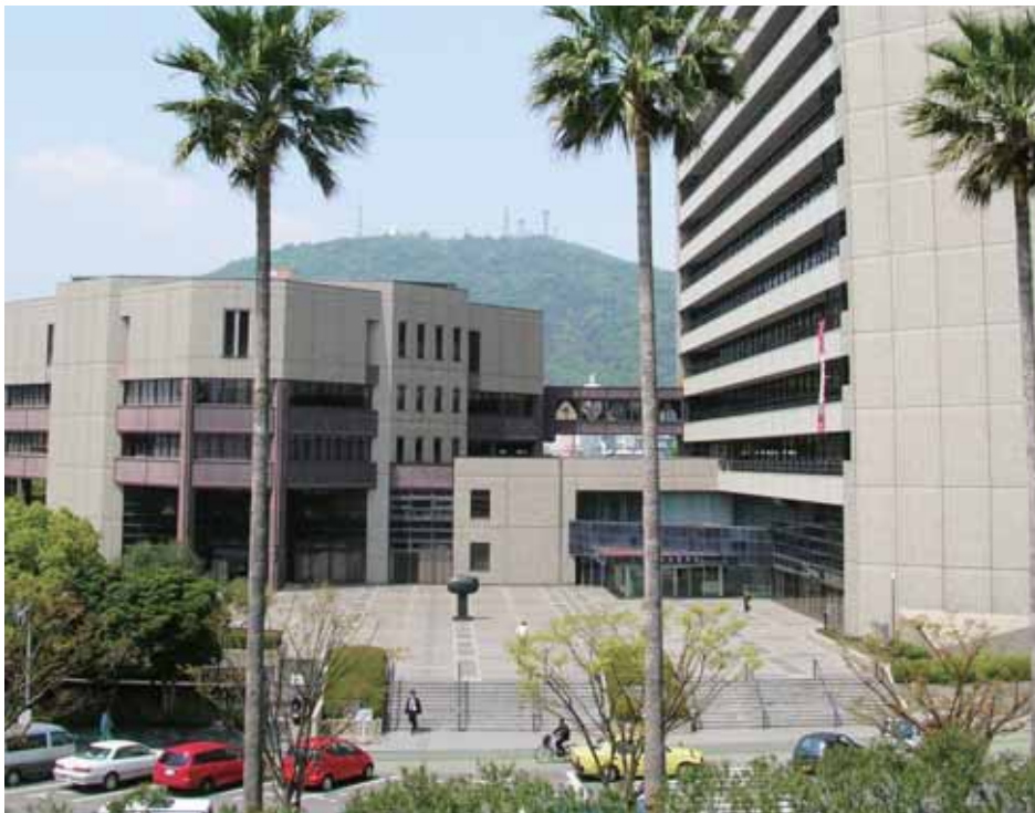
とくしまし じむ おこな やくしよ 徳島市の事務を行う役所