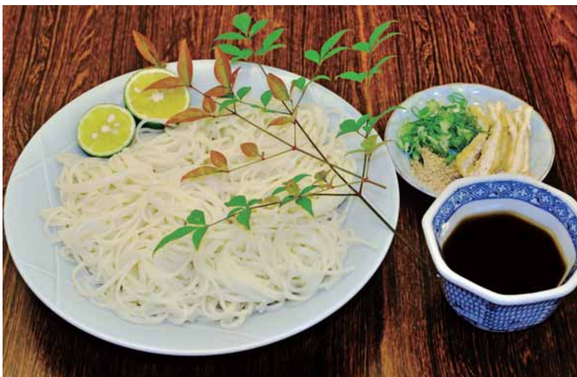
つるぎ町 ちよう で作られている ふと 太い めん 麺。