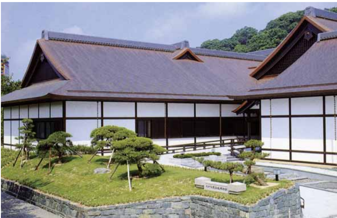
とくしまちゅうおうこうえん なか はくぶつかん 徳島中央公園の中にある博物館。