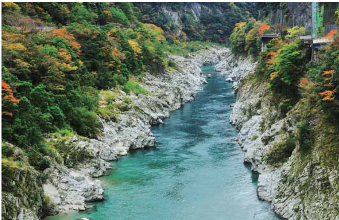
とくしまけんせいぶ よしの がわちゅうりゅうぶ やく きょうこく 徳島県西部、吉野川中流部に約8kmにわたる峡谷。