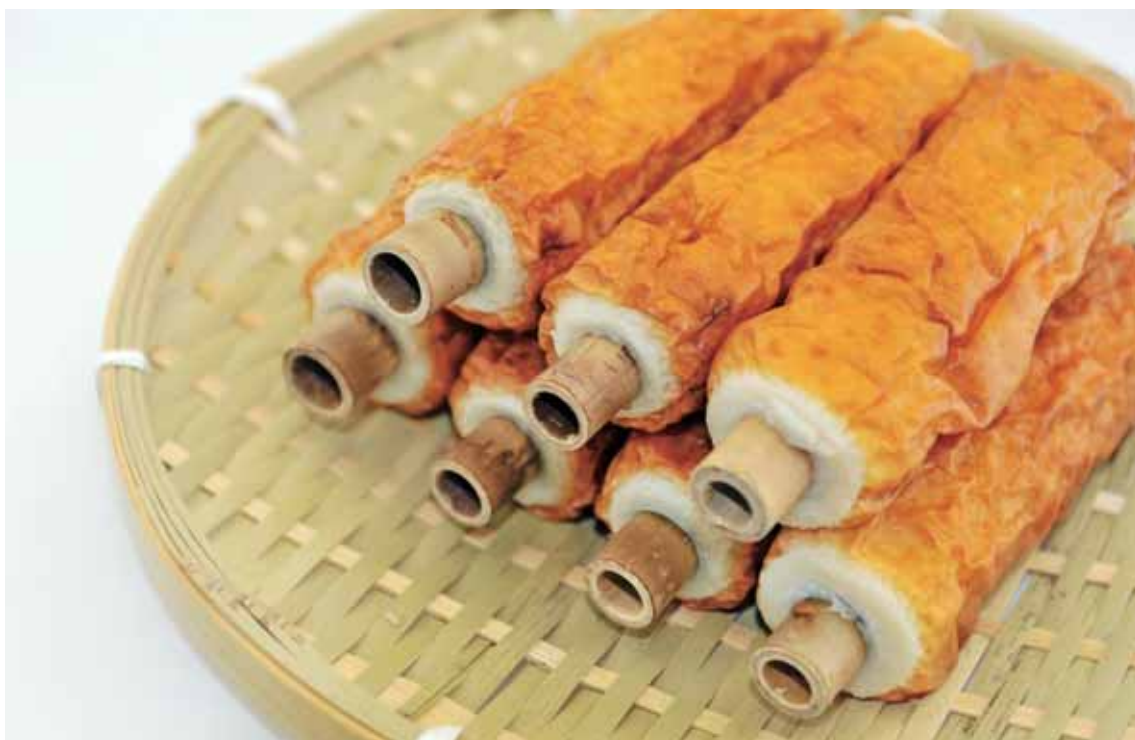
たけ さかな み ま や こまつまし めいさんひん 竹に魚のすり身を巻きつけて焼いた、小松島市の名産品。