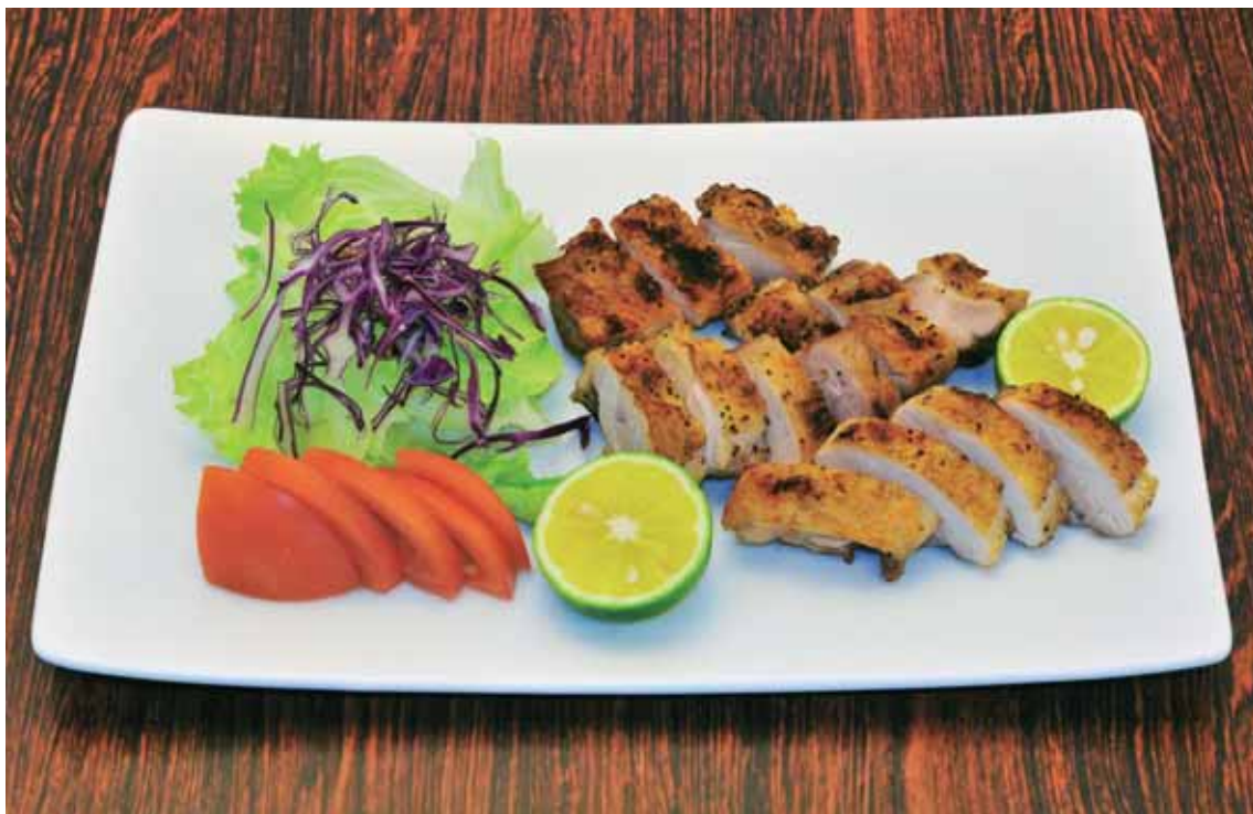
とくしまけん しゅう とり 徳島県で飼育されている鶏。