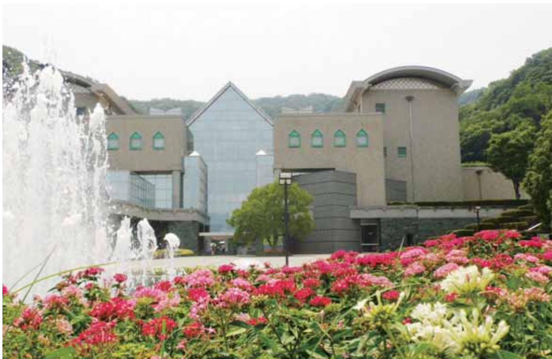
としょかん はくぶつかん びじゅつかん もんじょかん こうえん ひろ ばしょ 図書館、博物館、美術館、文書館、公園などがある広い場所。