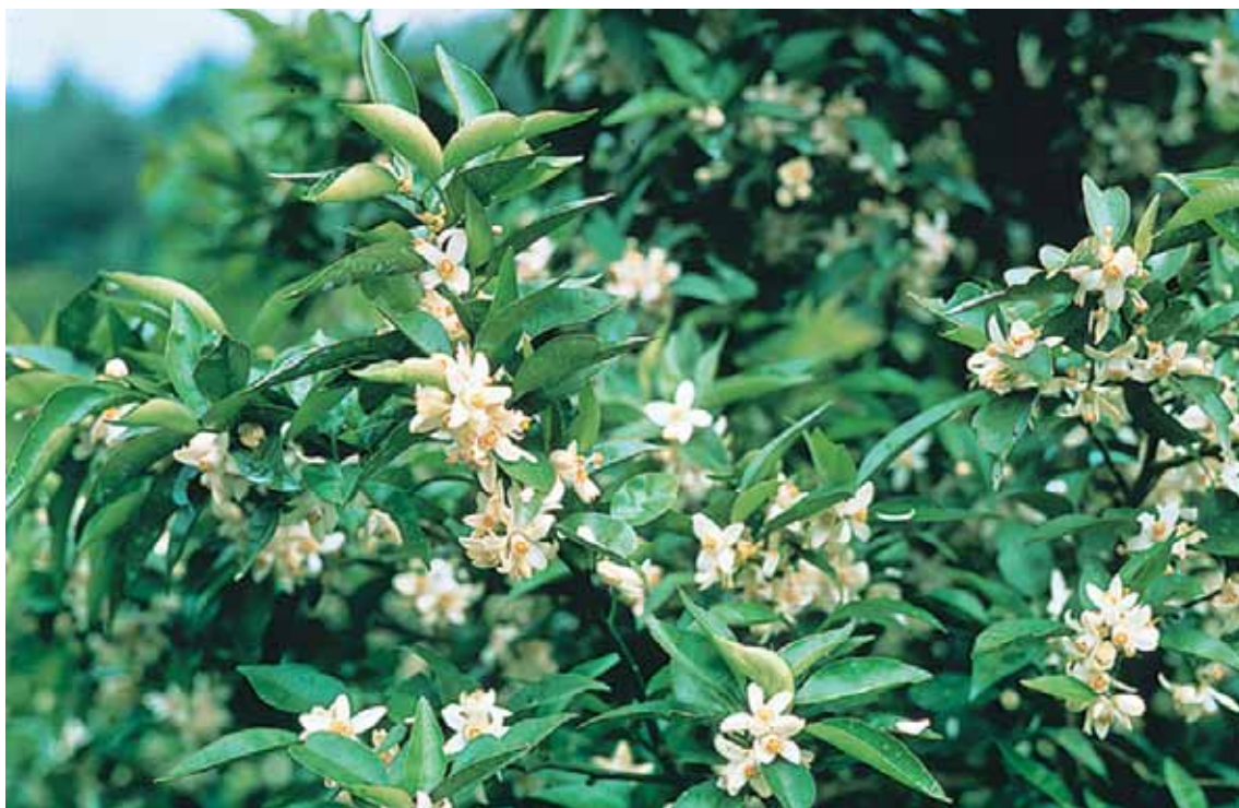
とくしまけん はな 徳島県の花