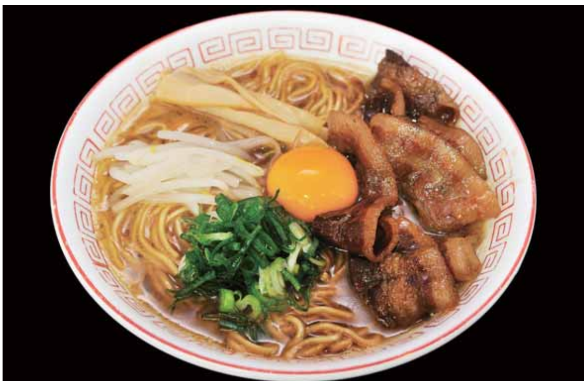
とくしまけん とうち 徳島県のご当地ラーメン。