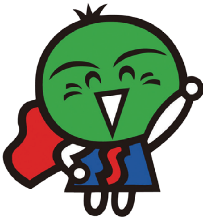
とくしまけん 徳島県のマスコット（ゆるキャラ）