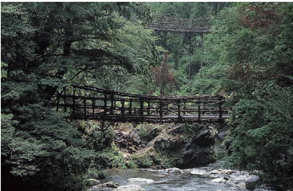
みよしし おくい や にじゅう ばし 三好市の奥祖谷にある、祖谷川に架かる吊り橋。