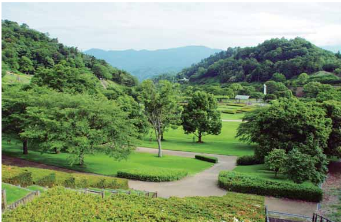
かみやまちょう こうえん 神山町にある公園。