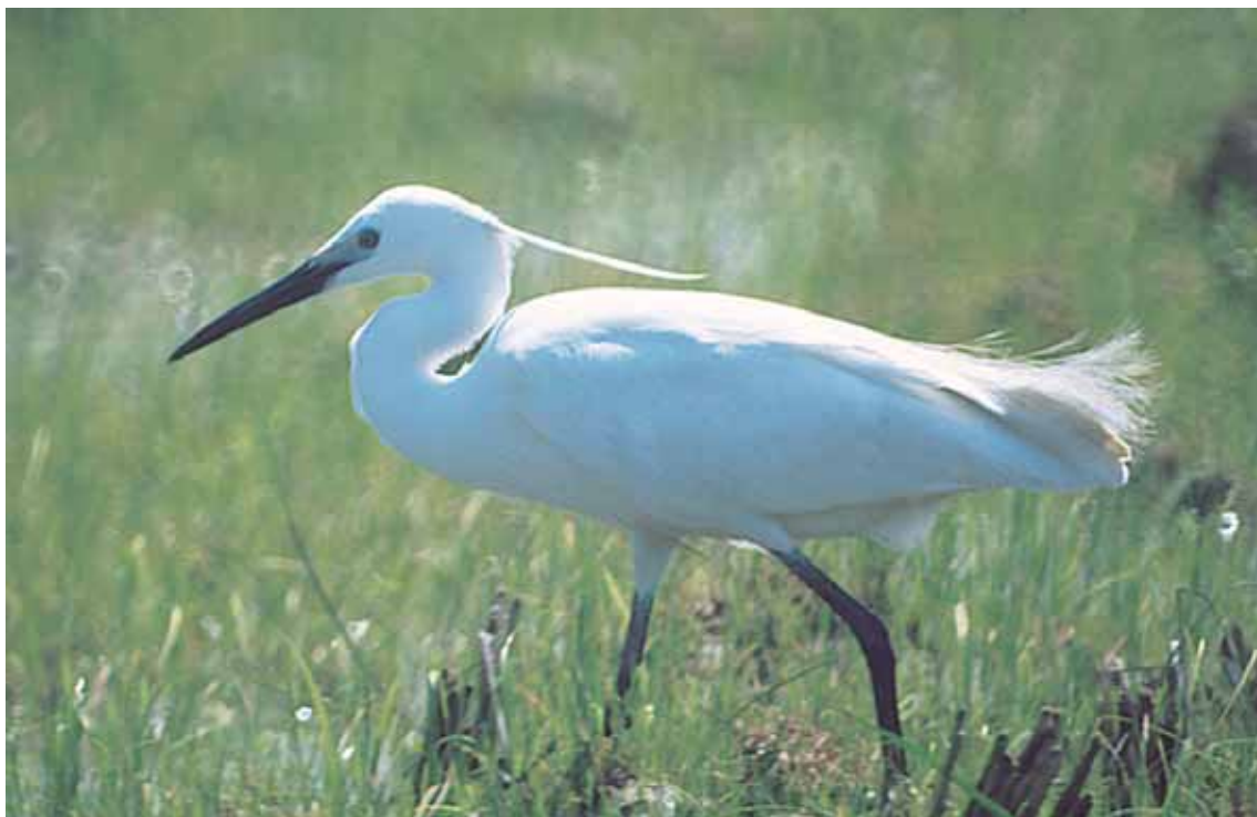
とくしまけん とり 徳島県の鳥