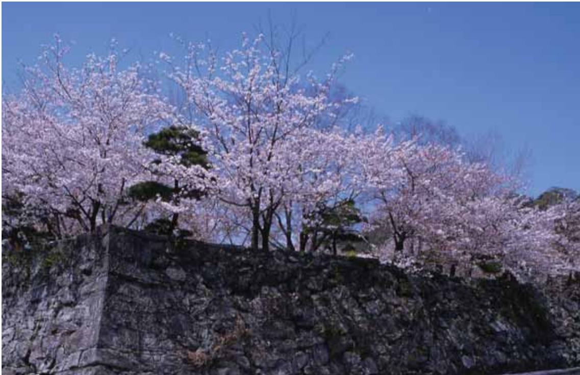
しろやま ひろ こうえん むかし しろ さくら めいしょ 城山とそのまわりに広がる公園。昔、城があった。桜の名所。