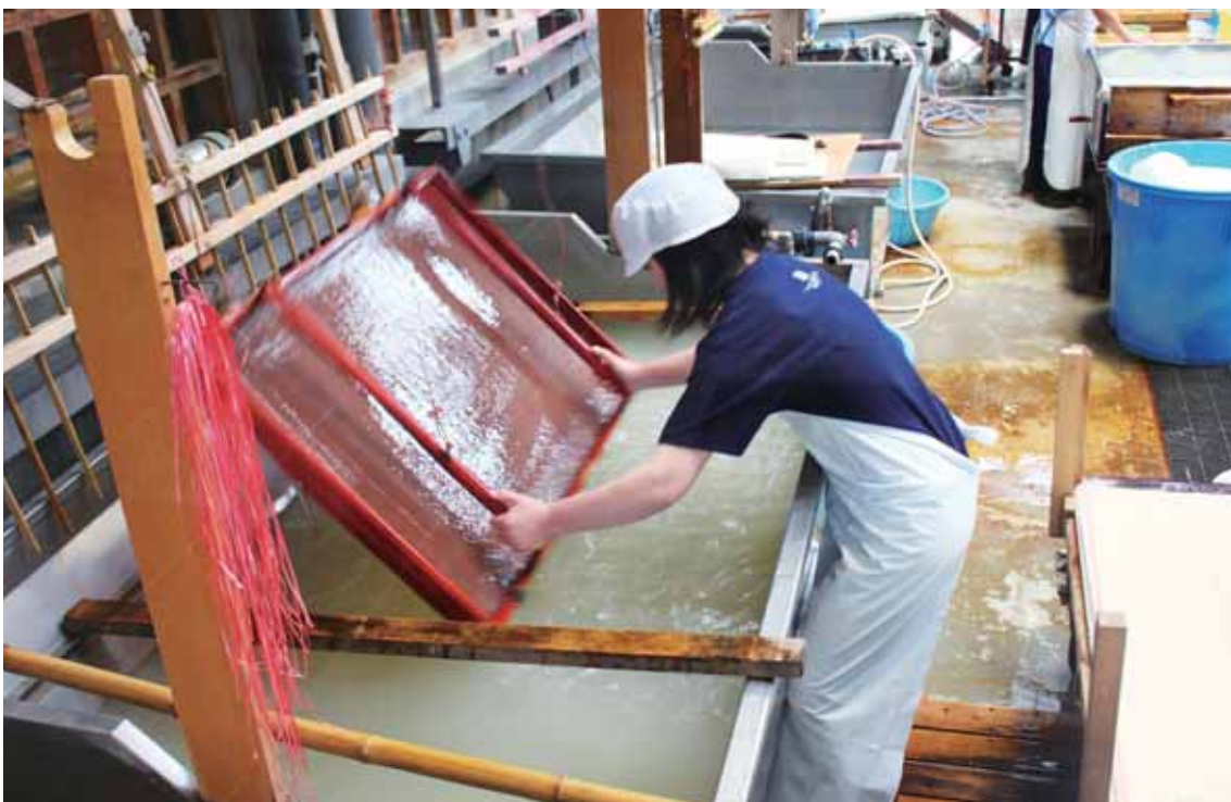
よしのがわし であわし けんがく たいげん 吉野川市にあり、阿波和紙づくりの見学や体験ができる。