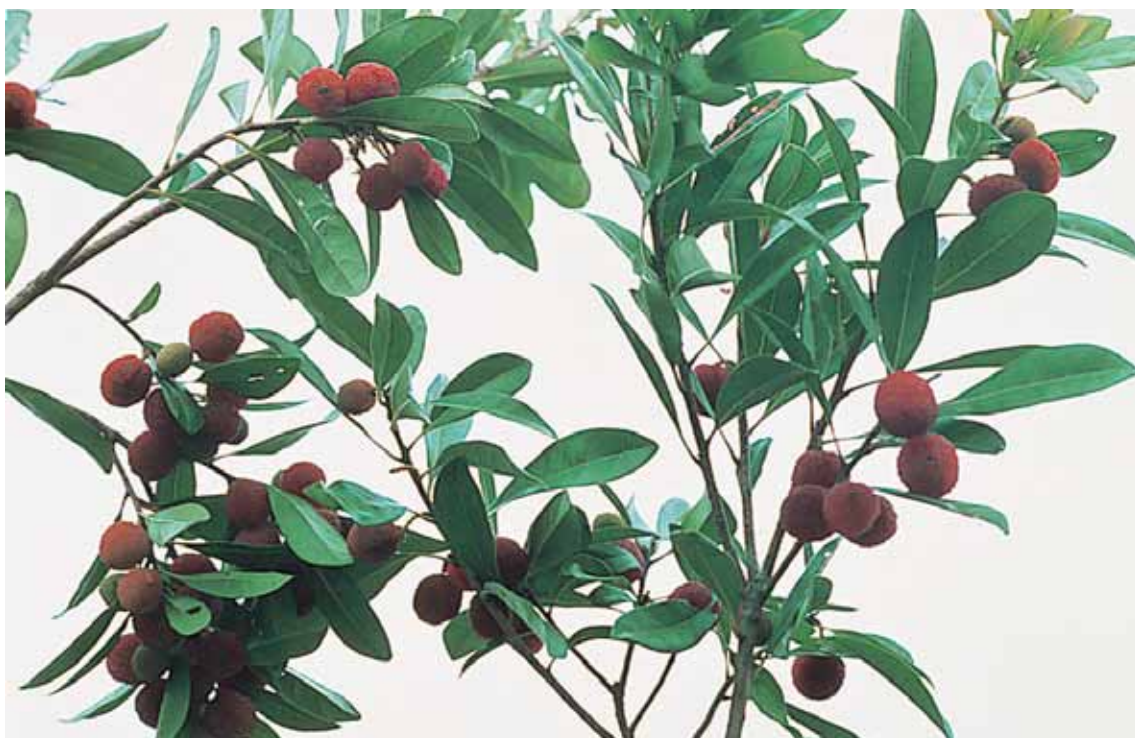
とくしまけん き 徳島県の木