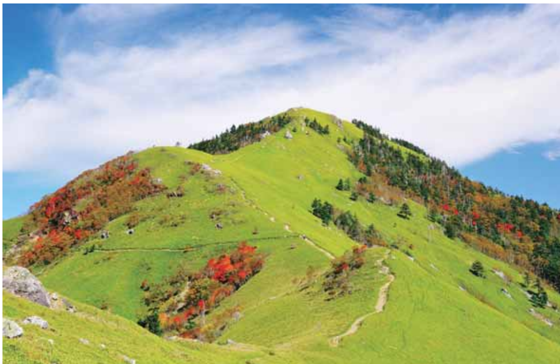
とくしまけんちゅうせいぶ たか やま 徳島県中西部にある、高さ 1,955m の山。