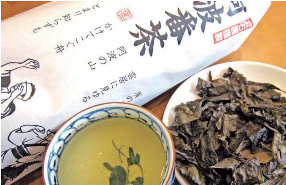
なかくんなかちょうかつうらくんかみかつちょうつく 那賀郡那賀町と勝浦郡上勝町で作られるお茶。