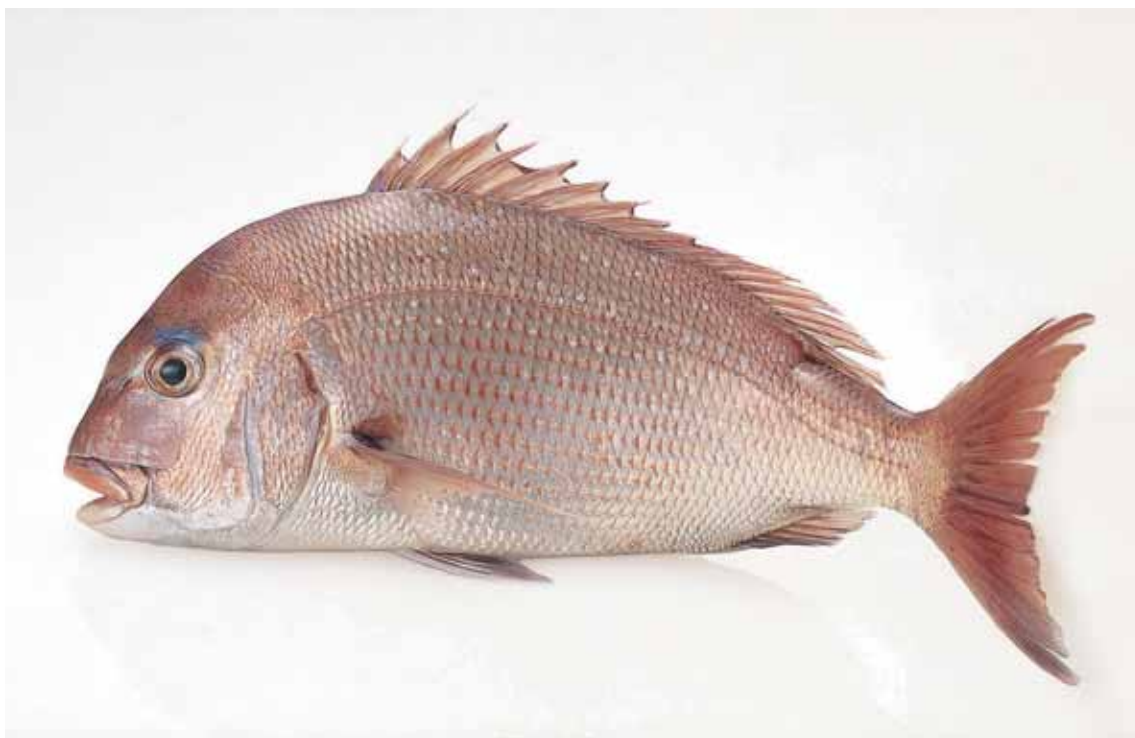
なると かいきょう うずしお そだ 鳴門海峡の渦潮で育った鯛。 たい み 身がしまっている。