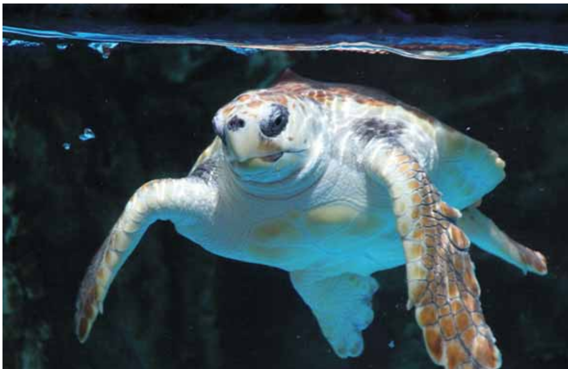
かいふくみ 海部郡美波町 おおはまかい にある た 大浜海岸 はくぶつかん に建つアカウミガメの博物館。