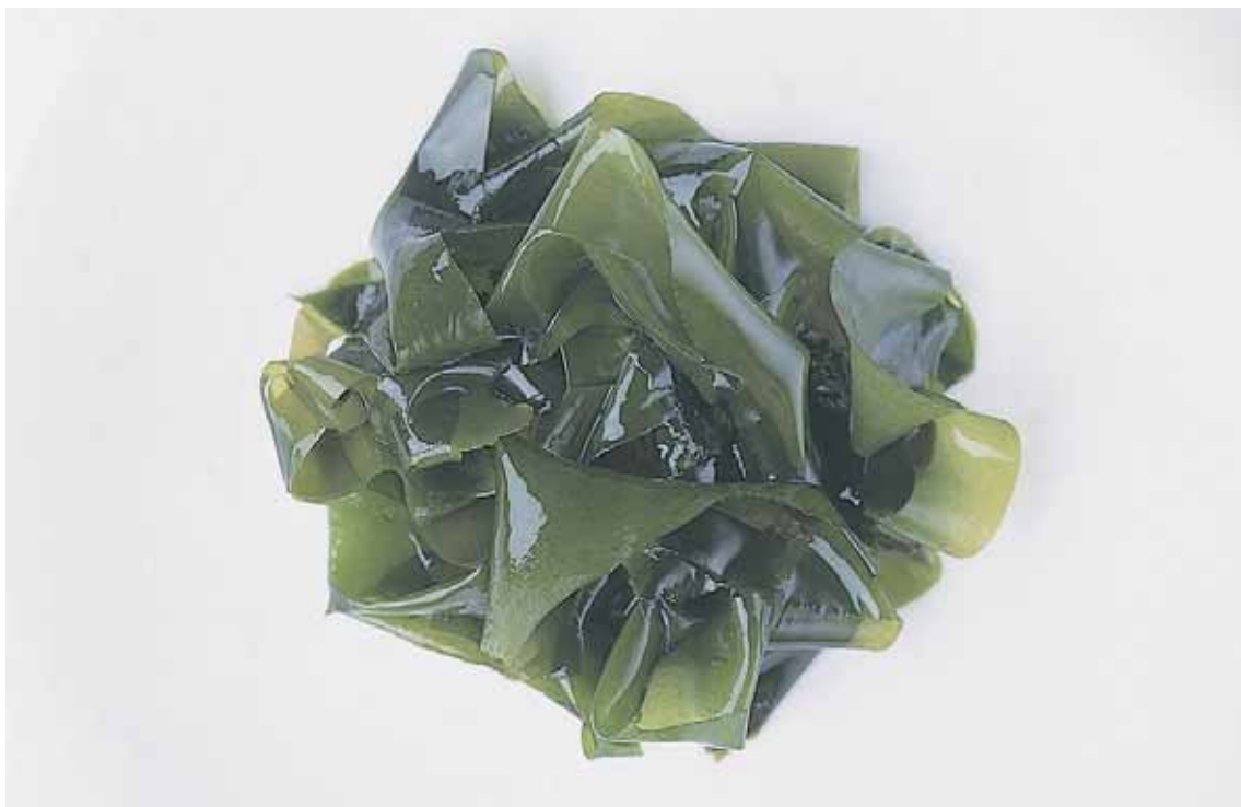
なると かいきょう そだ 鳴門海峡で育ったわかめ。 つよ 強いコシがある。