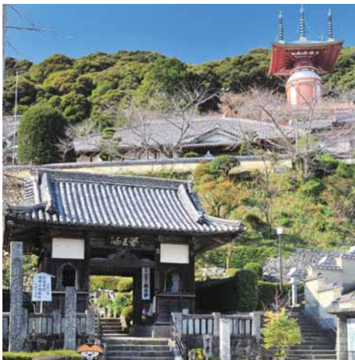
かいふくみ 海部郡美波町 しこくはちじゅうはち にある、 しよれいじょう 四国八十八か所霊場の ばんめ 23番目の寺。 てら 厄除けの寺。