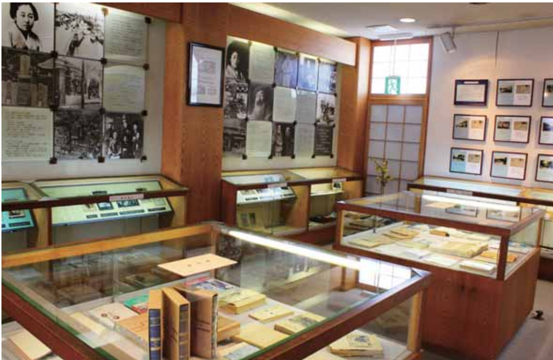
ポルトガルの外交官であるヴェンセスラウ・デ・モラエスの がいこうかん 記念館。徳島市の眉山山頂にある。