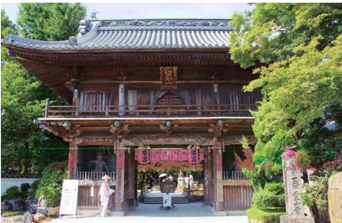
鳴門市大麻町にある、四国八十八か所霊場の1番目の寺。