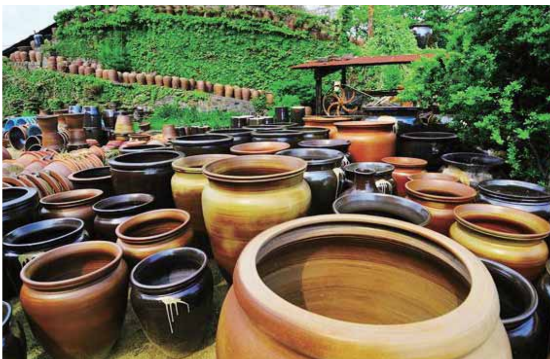
なるとしおおあさちようおたにつくとうき 鳴門市大麻町大谷で作られている陶器。