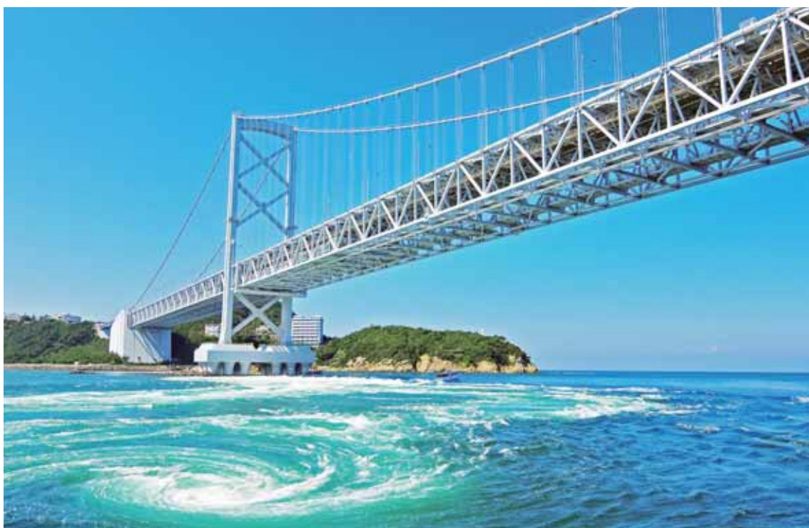
とくしまけんなる と し ひょう ごけんみなみ し あいだ なる と かいきょう うず 徳島県鳴門市と兵庫県南あわじ市の間にある鳴門海峡にできる渦まき。