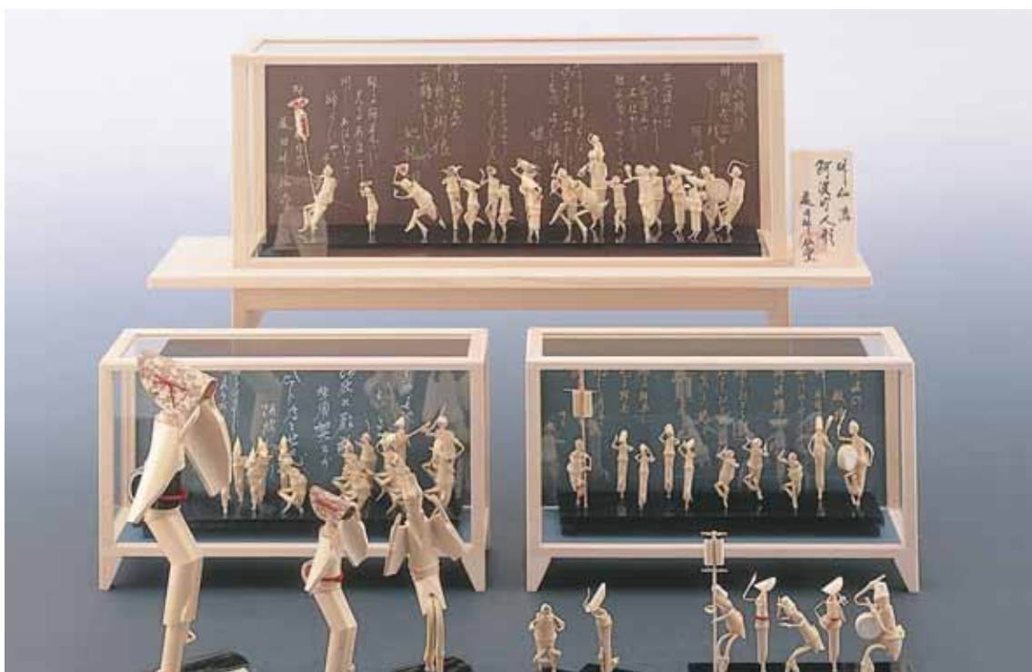
たけ つく にんぎょう 竹で作った人形。