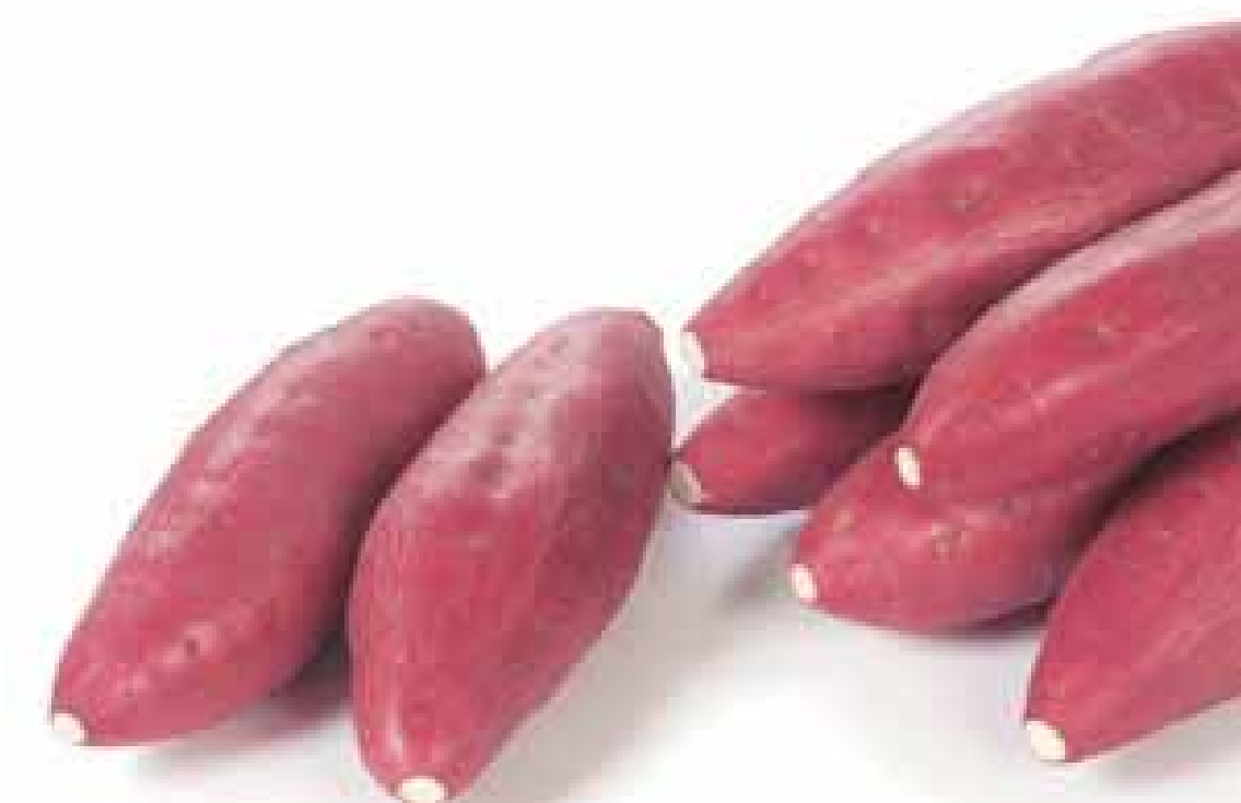
とくしまけんない すなち そだ 徳島県内の砂地で育てられた、さつまいも。