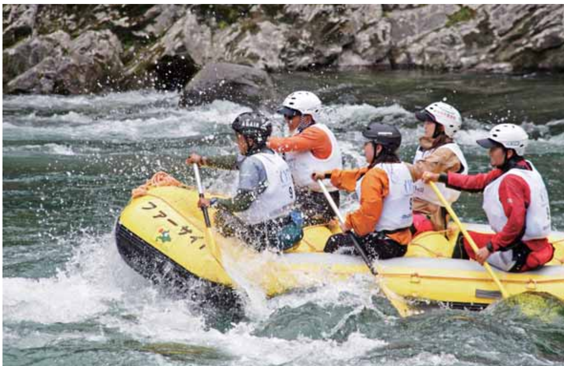
よしの がわ おおほけ こほけ おお がわ くだ 吉野川の大歩危・小歩危にて、大きなゴムボートで川を下るアウトドアスポーツ。