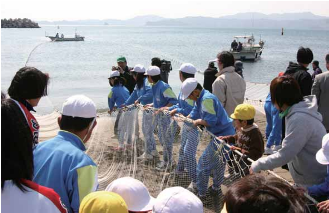
あなんし きた わきかいすいよくじょう おこな かんこう じ び あみ 阿南市にある、北の脇海水浴場で行われる観光地引き網。