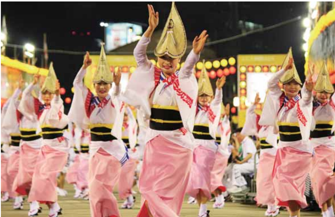
おんなもの ゆかた あみがさ げた おど 女物の浴衣に、編笠をかぶり、下駄をはいて踊る。