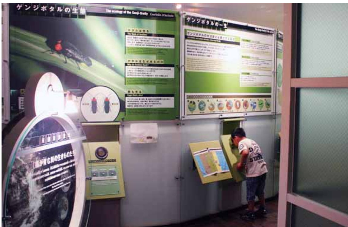
ホタルに関する展示が見られる施設。