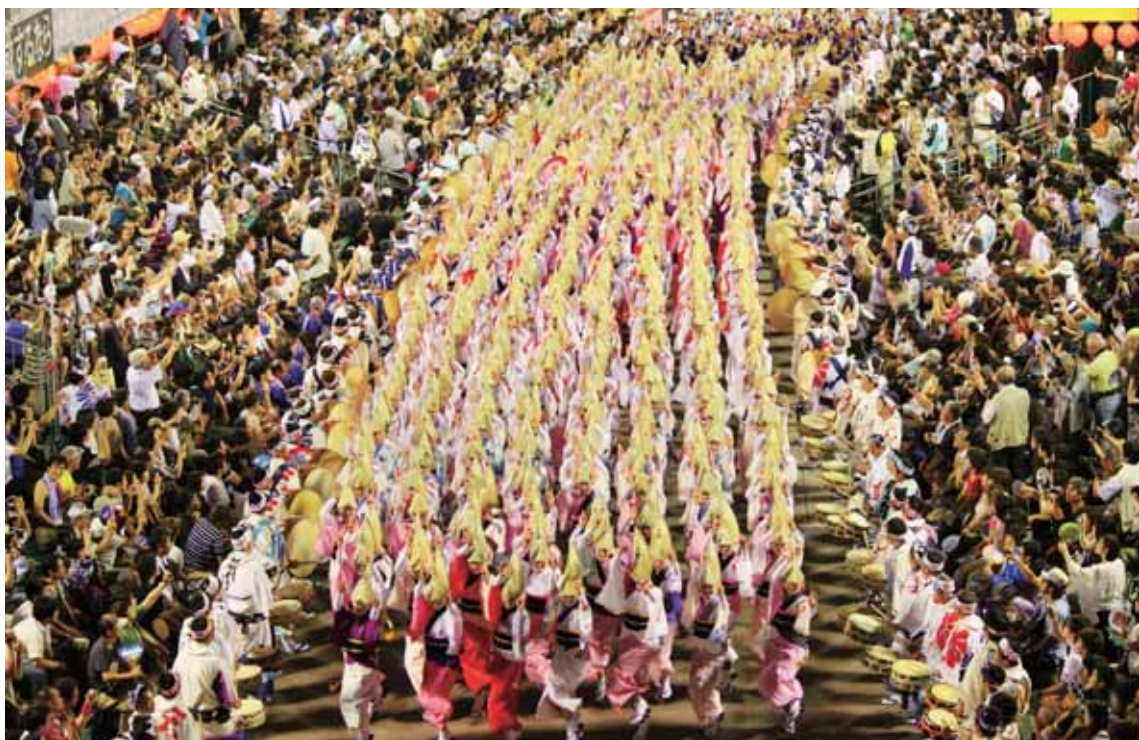
徳島県の夏祭りの踊り。