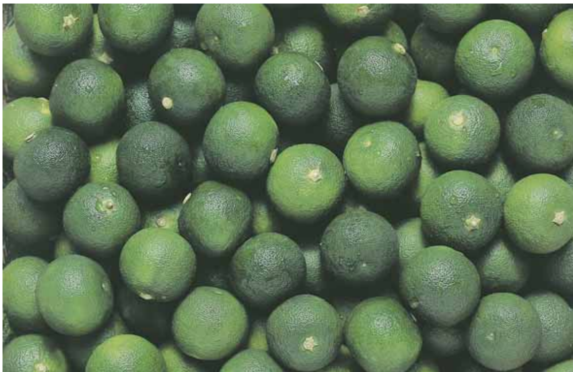
とくしまけんげんさん けいくだもの せいさんりょうぜんこくだい い 徳島県原産のかんきつ系果物。生産量全国第1位。