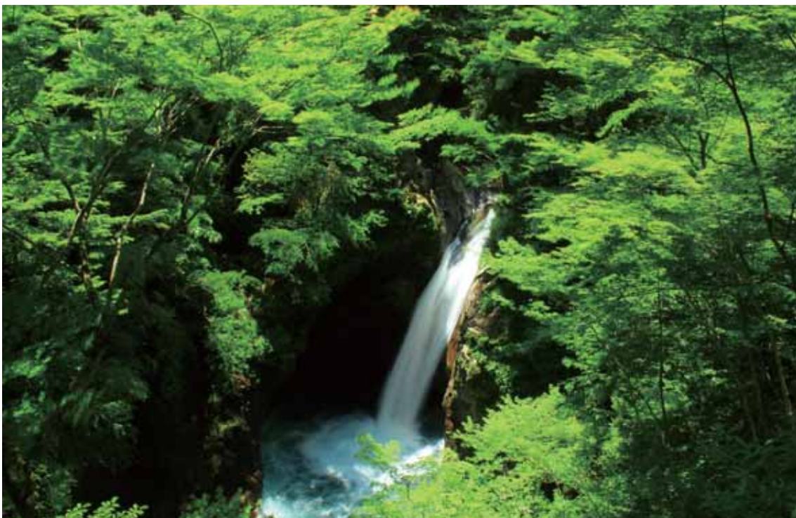
なかぐんな かちょう たき 那賀郡那賀町にある滝。