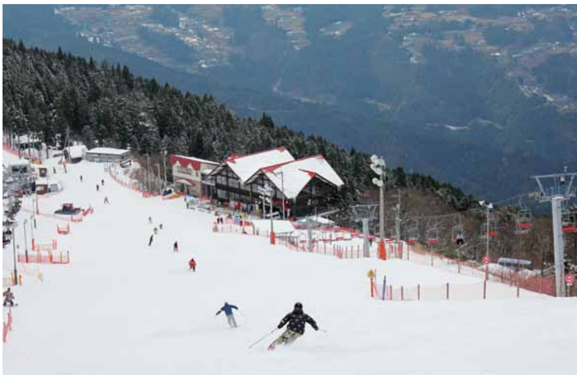
みよしし いかわちょうかいなやま じょう 三好市井川町の腕山にあるスキー場。