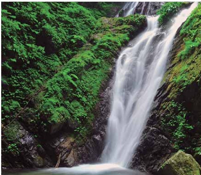
みょうざいくんかみやまちょう 名西郡神山町にある滝。 たき