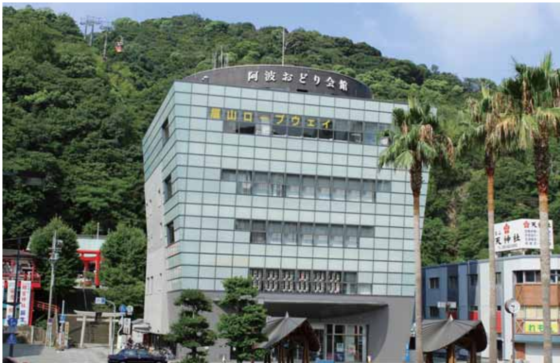
徳島市にある、阿波おどりを一年中楽しめる建物。