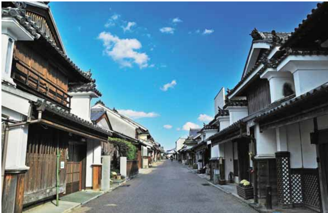
みましわきまち むかし あいしょうにん いえ ほぞん まちな 美馬市脇町にある、昔の藍商人の家が保存されている町並み。