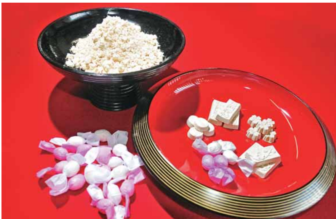
サトウキビ つか を使って つく 作られた さとう 砂糖。