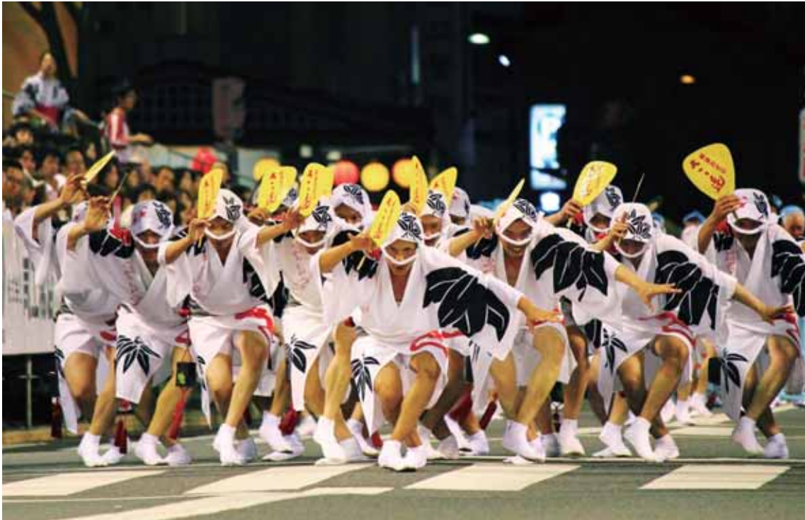
おとこもの ゆかた おど 男物の浴衣や、はっぴを着て踊る。