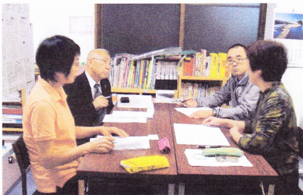
打ち合わせ会議(2013/10・5 大和にて)