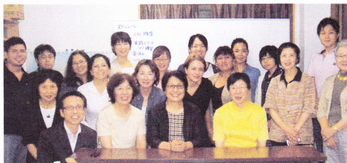
養成講座 最後にみんなで 2013/9/23)