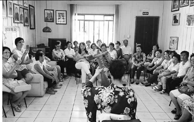
ブラジルでは浴衣姿で『平家物語』をお届け

Performing “ Heike Monogatari ” (The Tale of the Heike [Taira Clan]), wearing a yukata (a summertime cotton kimono )