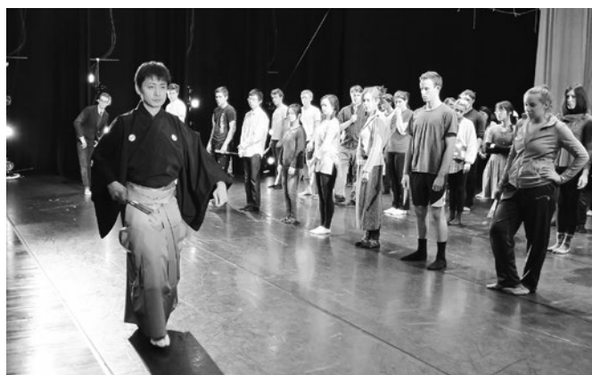
『すり足』の実演に見入る学生たち Students watching the performance of suriashi (sliding feet)

After each demonstration, I deliberately explained the meaning of the work in words, because the focus of the Komparu School for the past 1,400 years has been to pray for global happiness through Noh plays, based on the School’s understanding of the embracing of diversity and co-existence/co-prosperity. The School was founded by an immigrant from China who came to Japan via Korea, and was developed through incorporating the art and religion of China into indigenous counterparts. In my explanation of the roots of Noh, I underscored the fact that Japanese people have always embraced differences and incorporated them into their own culture. I communicated this in words in hope that, given all the challenges faced by the world today, the audience would sense the significant role Noh can play in remedying these challenges. My words were received with deep empathy and applause at many venues, suggesting that I was able to convey the “heart of Japan” through Noh.