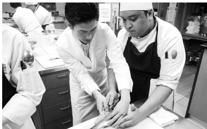
カナダ ジョージブラウン大学にて和包丁を使って魚を捌く Cutting fish with a Japanese knife at George Brown College in Canada