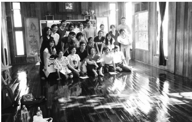
タイ バンコクにて、ワークショップに参加した学生と Together with students attending the workshop in Bangkok, Thailand

I will give you one example. I felt as if I had gained a new vision to identify myself as an East Asian while I was in China.