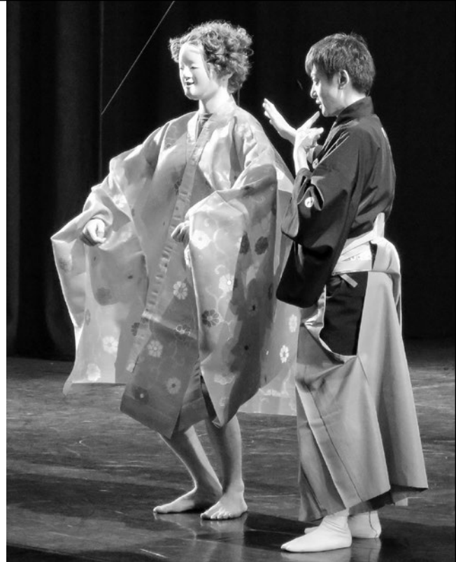
学生による能面・装束の体験 視野の狭さに驚嘆した様子 Students tried wearing Noh masks and costumes. Putting on the masks, they seemed surprised at the narrow fields of vision

Specifically, I held Noh workshops and demonstrations, and co-produced Noh dramas at events for the general public, and at schools and universities. For a workshop in Vancouver, I held a five-day training session in utai (vocals) and shimai (performance without masks or costumes) for 20 locals, topped off with a Noh performance. Thirty members of my support group came from Japan to take part in the performance as guest actors and we had a great time of friendship exchange. Also in Vancouver, I co-produced and played the leading role in an experimental Noh opera, “MOMOYA” composed by a local musician based on the Noh play “ Kayoi Komachi ” (Courting