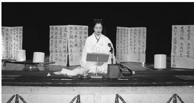
中南米では『耳なし芳一』を、NYでは『雪女』 Performing "Miminashi Hōichi" (Hōichi the Earless) in Central and South America, and "Yuki Onna" (The Snow Woman) in New York

文化交流使をお引き受けしてから、「文化交流の持つ意味とは？」という言葉が常に頭を駆け巡っていましたが、ある経営者の方から「俺たちは物作りのプロ。でも文化までは運べない。」という言葉頂きました。日本文化に裏打ちされた高性能の技術や製品ではなく、「文化を運ぶ」とはどういうことなのか。文化を届けることで日本人の気質や日本そのものを知ってもらい、そのことが物流や経済に繋がるのだとしたら、一文化人としての自分の役割は大きい。それを意識しながら、自分なりの文化交流を突き詰めていけば、より深みのある人生を歩むことができるのかもしれない。そんなことを考えながら活動に励みました。