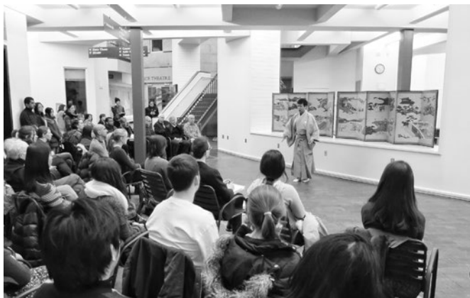
一般・学生向けに能の舞を実演 Performing Noh dance for the audience and students

実演の後には必ず、敢えて「言葉」で、作品の意義をお話ししました。それは「多様性の享受」「共存共栄」。我が金春流は 1400 年に及ぶ永き古から、能を通じて「皆が幸せであることを祈る」ことを続けてきました。金春流の初代は中国・韓国からの渡来人であり、大陸からの宗教や芸能と、日本古来の宗教・芸能が渾然一体となり熟成され、今日の能が成立したのですが、こうした「能のルーツ」をお話しする中で、日本人は〈異なる〉ことを認めて受け入れることを永年行ってきたことを強調しました。敢えて言葉にすることで、今世界が直面している様々な問題を意識し、そうした状況における能の深い存在意義を伝えたかったのです。その結果、各地で深い同意と拍手を得ることができ、能を通じて「日本のココロ」を伝えることができたと感じています。