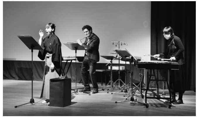
2015/10/21 ケルン日本文化会館 “Noh × Contemporary Music 細川俊夫氏を迎えて”

On September 22, 2015, “Noh × Contemporary Music Inviting Mr. Peter Eötvös” at Budapest Music Center in Hungary