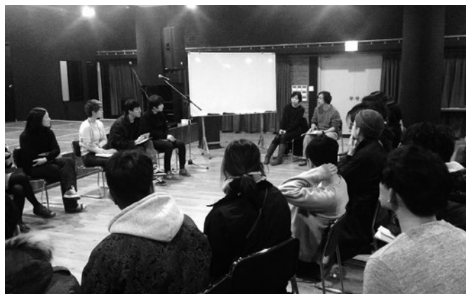
韓国 光州にて、アートを学ぶ学生とのディスカッション Discussion with students learning art in Kwangju, Korea

韓国にはそれなりに長い期間滞在できたため、日本と韓国の政治的・歴史的な関係をめぐるさまざまなことをこれ