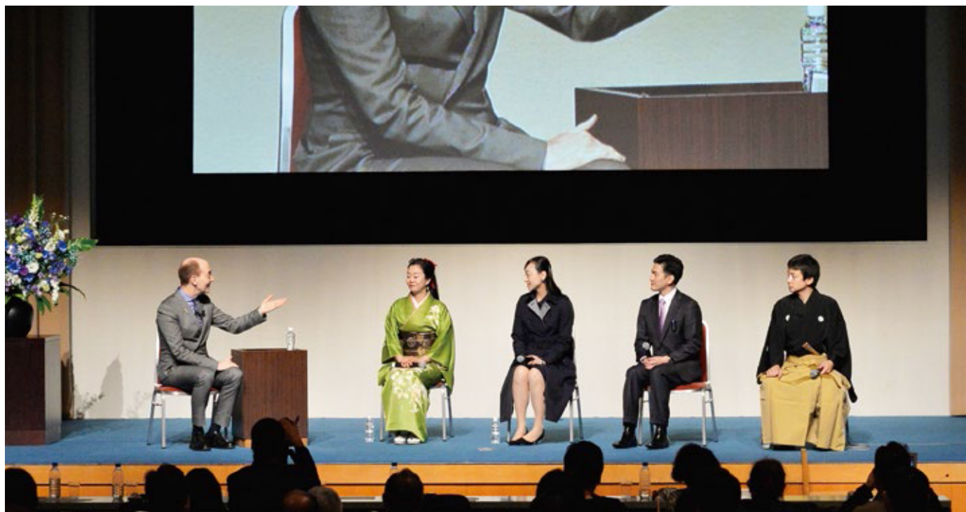
出演者全員によるトークセッション

琵琶の音色や雰囲気近くで感じてもらいたかったので、お客さんに舞台へ上がってもらった。間近で聞いてもらったことで化学反応が起きたと思っている。