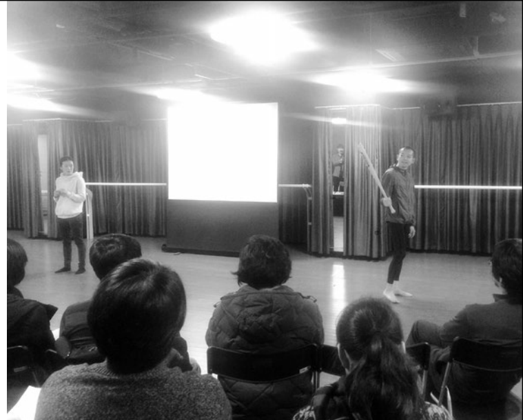
韓国 ソウルにて、新作の公開リハーサル Open rehearsal of a new play in Seoul, Korea

However, that vision was suppressed in Korea. This is because in Korea a Japanese person who tries to identify himself/herself as East Asian is regarded as trying to escape from the responsibility he/she should assume for Korea as a Japanese national. This entire process was a great experience for me.