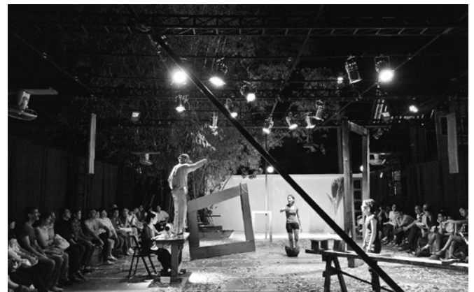
タイ バンコクにて、コラボレーション作品の公演 Performance of a collaborative production in Bangkok, Thailand

Working or writing plays to be shared under the framework of East Asia—I acquired so much experience in these two months that I can now envisage realizing it. As I gained something very valuable, I would like to make good use of it from this point forward.