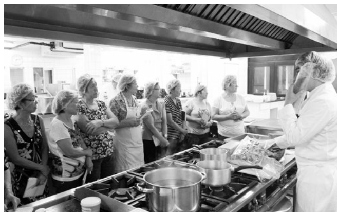
ブラジル クリチバ日系婦人会講習風景 Seminar for the Japanese Women's Association in Curitiba, Brazil