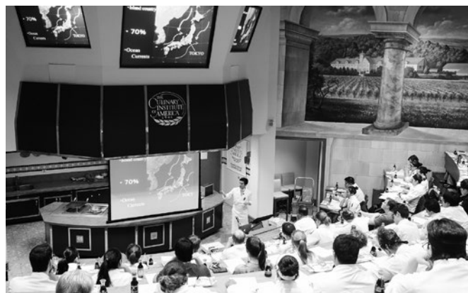
アメリカ カリナリー・インスティテュート・オブ・アメリカにて「なぜ日本は魚食文化が発展したか」についての説明中 Discussing why fish-eating culture was developed in Japan at The Culinary Institute of America, the United States