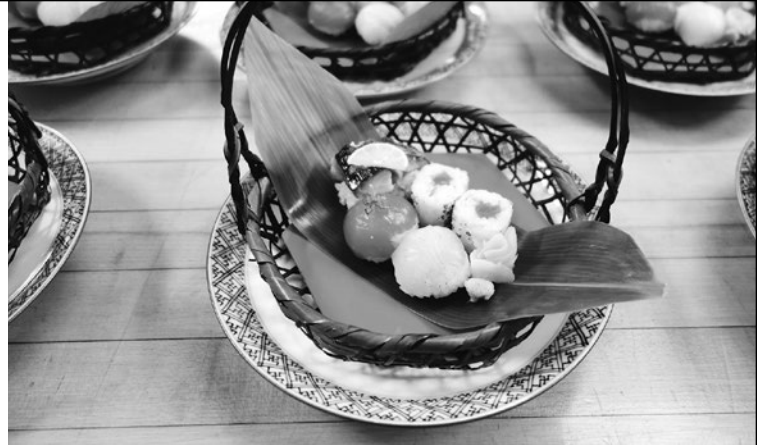
カナダ大使館公邸食事会での料理 サーモンとたい昆布締めの手鞠寿司 Menu of the dinner at the Japanese Ambassador's Residence: temari-zushi using salmon and sea bream sandwiched between sheets of kombu kelp

At the cooking practice, students actually made three or four dishes I had demonstrated. I prepared ten Japanese kitchen