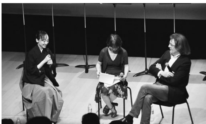
2015/7/3 パリ日本文化会館 “Noh × Contemporary Music パスカル・デュサパン氏を迎えて”

On July 3, 2015, “Noh × Contemporary Music Inviting Mr. Pascal Dusapin” at the Japan Cultural Institute in Paris, France Photographed by Japan Foundation