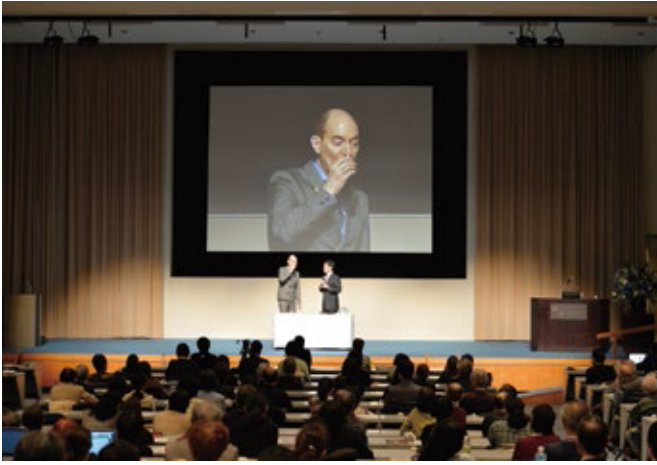
だしの飲み比べの様子

をよく知っている。しかし例えば昆布に触ったり、香りを感じたりすることはインターネットではできない。実際に食材や器などに触れる、または日本に来てもらうことが必要だ。