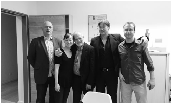
2015/9/22 ハンガリー Budapest Music Center “Noh × Contemporary Music ペーテル・エトヴェシュ氏を迎えて”

On September 22, 2015, “Noh × Contemporary Music Inviting Mr. Peter Eötvös” at Budapest Music Center in Hungary