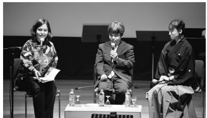
2015/10/21 ケルン日本文化会館 “Noh × Contemporary Music 細川俊夫氏を迎えて”

I came back to Japan after completing the activities as a Japan Cultural Envoy for about 100 days. I know that my cutting-edge activities combining Noh with contemporary music are difficult for the public to understand. However, my activities have been repeatedly introduced through the Japanese mass media due to my service as a Japan Cultural Envoy. I sincerely hope that my performance opportunities will increase further not only in Europe but also in Japan, such as Aichi Triennale where I will work as a nominated member artist this year. I would like to make the next leap forward, taking this experience as the first step.