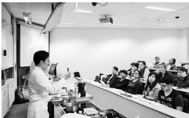
ニュージーランド オークランド工科大学でのデモンストレーション風景 だしをひいているところ Demonstration on how to make dashi soup at Auckland University of Technology in New Zealand