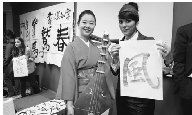
わずか30余年前まで日本と国交のなかったアルバニア。アルバニアっ子は日本大好き Diplomatic ties between Japan and Albania were established only 30 years ago. Many Albanians love Japan.