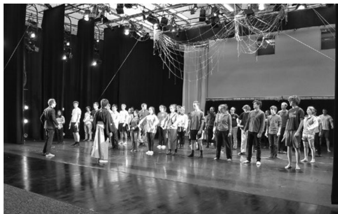
アメリカ バーモント州ミドルベリー大学でのワークショップ Workshop at Middlebury College in Vermont, the United States

具体的には、一般の方向けや学校・大学において、能ワークショップ、共同制作、デモンストレーションを行いました。特に、カナダ・バンクーバーで行ったワークショップでは、現地の方 20 名に謡・仕舞の 5 日間連続稽古を実施し、最後は発表会を敢行。日本から応援に来た私の後援会社中 30 名も客演し、親善交流が実現しました。また、同じくバンクーバーでの現地作曲家による能『通小町』を基にした実験能オペラ『MOMOYA』の共同創作では、自ら主演を務め、