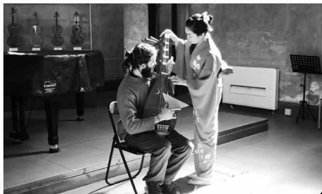
イタリアクレモナ・ストラディヴァリウスヴァイオリン養成所の学生と Instructing a student at the Antonio Stradivari International School of Violin Making in Cremona, Italy

The program I performed included “ Kaidan: Miminashi Hōichi ”; warabe uta (traditional children’s songs), the lyrics of which reflect a time of poverty and which are sung with tunes very unique to Japan; and “ Heike Monogatari .” I wondered how my explanation of the opening passage of Heike Monogatari , called “ Gion Shōja ,” which was accompanied by a biwa performance full of wabi-sabi (a sense of simplicity and quietude), would be accepted by local audiences, but I just had to play it and see what happened. I set the stage with items which would create a Japanese ambience, such as candles (battery-operated), a red rug, floor lamps, and a display of “ Hannya Shingyo ” (Heart of Great Perfect Wisdom