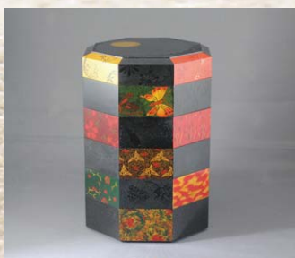
八角五段重箱「お祝い」 津軽塗技術保存会蔵

重要無形文化財に指定される工芸技術の性格上個人的特色が薄く、かつ、そのわざを保持する者が多数いる場合には、これらの者が主たる構成員となっている団体を保持団体として認定しています。