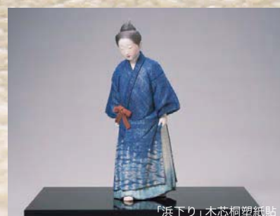
「浜下り」木芯桐塑紙貼