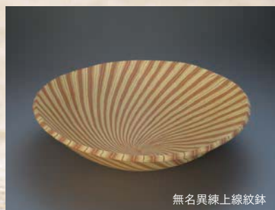
無名異練上線紋鉢

工芸技術の分野では、陶芸、染織、漆芸などの分野において、多くの重要な無形文化財を指定し、保持者を認定しています。