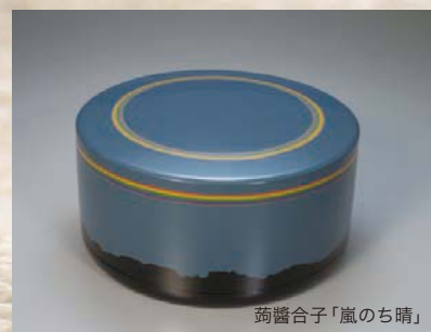
蒟醬合子「嵐のち晴」