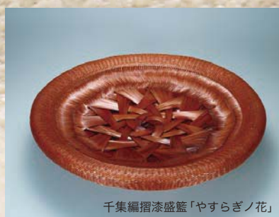
千集編摺漆盛盤「やすらぎノ花」