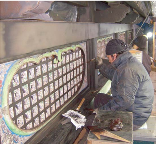
「建造物漆塗」保存団体 (公財) 日光社寺文化財保存会