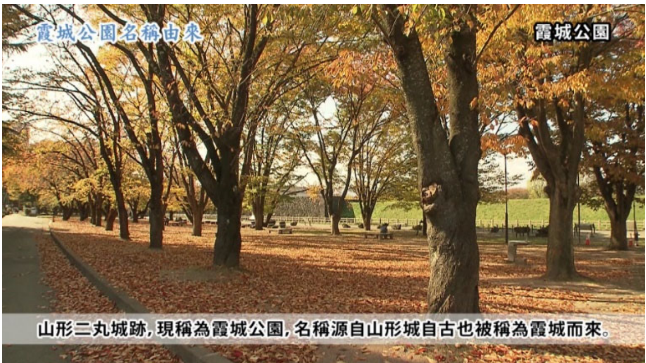
山形歴史地区 霞城公園與二丸東大手門 https://www.youtube.com/watch?v=o098Do3mmDM&t=3s

その一方、休館せざるを得なかった博物館がオンラインコンテンツに力を入れた結果、文化遺産の情報をインターネット上で公開する技術的なハードルが下がった。一般的にもオンライン上で文化遺産が鑑賞できることが広まった。その流れにのり、本事業でこれまで構築してきたサイト ( https://my-favorite-things-about-yamagata.com/ ) を利用し、最上義光歴史館が独自に作成した動画を台湾向けに再編集したもの ( https://www.youtube.com/watch?v=o098Do3mmDM&t=3s ) を提供した。台湾は、かねてから山形市と人的交流があることに加えて、新型コロナウイルス感染症の抑え込みに成功しており、コロナ終息後にはもっとも来形が期待できる地域である。