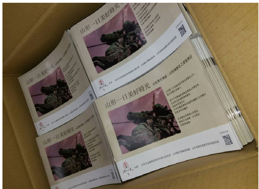
山形の文化遺産と観光情報を紹介する小冊子

動画の配信と合わせて、山形の文化遺産および観光情報を解説するパンフレットを作成した。写真を多く用い、視覚的・直感的に山形の文化遺産と観光情報を伝えることと、気軽に持ち運べる携帯性を重視した。また、そして、日本語版の他に台湾の旅行会社、教育機関に配布広く配布し、台湾・山形の交流継続をはかった。