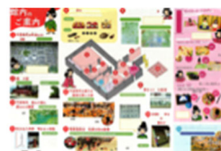
リーフレット(展開 A3) 裏面