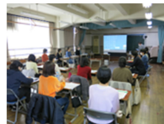
【文化財ワークショップ（3月7日） 開会のあいさつ】

参加者からの声（アンケートより） 「現在進行形で作品を生み出している作家の方たちの制作に至る経緯や、解釈の受け取り方などを聞くことができるのはとても新鮮だった。」「作品制作者として、どのように作品を社会とつなげていくのか、つなげるために不可欠な言葉をどうつくるのか、研究者と作家のお話を聞いてとてもうれしかったです。」「このように学生が参加できるイベントが今後もあるとうれしいです。」