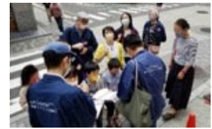
子ども対象ツアーの様子