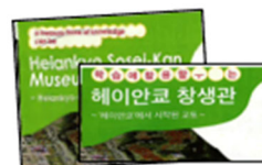
英語版・韓国語版