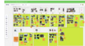
オンラインワークショップの画面