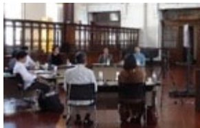
オンライン・シンポジウム

参加者からの声（アンケートより）「盛りだくさんで充実していました。建物の床下やホテルの様々なタイプの部屋を見せていただいて工夫されている点について聞けるなど、個人ではなかなか出来ないことが経験できました。」「昔のものとして大事にするだけでなく、今後、自分も関与して、どのように使っていけるか考えるきっかけになった。」