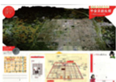
リーフレット(展開 A3) 表面