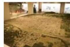
「京都市平安京創生館」館内

学習に活用できる「京都市平安京創生館」を紹介する多言語(日・英・中・韓)リーフレット(A3 4ツ折)を作成しました。