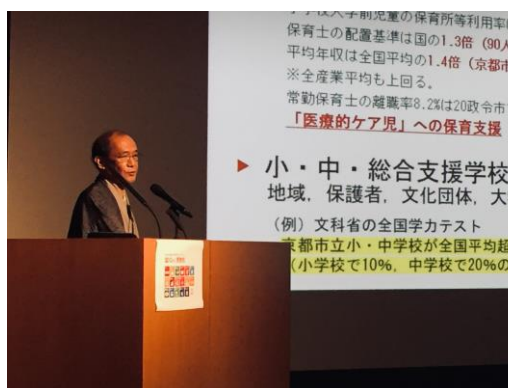
門川大作京都市長による基調講演 「京都市におけるSDGsの取り組みにつて」

< https://www.youtube.com/channel/UCNr8Uxf0OpnY1zk3ooBD5Sg >