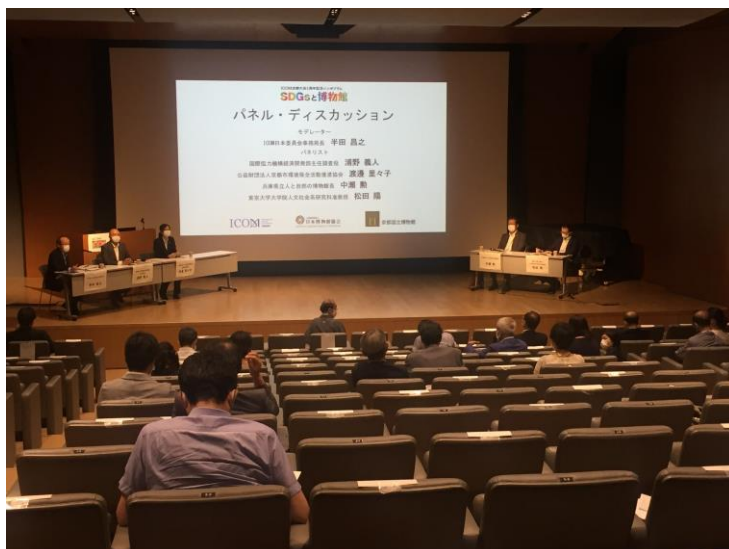
渡邊里々子氏（京都市環境保全活動推進協議会）、中瀬勲氏（兵庫県立人と自然の博物館）、浦野義人氏（国際協力機構）、松田陽氏（東京大学大学院）による SDGs と博物館に関するパネルディスカッション