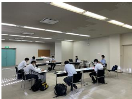
西宮市教育文化センター（中核館所在）での打ち合わせの様子

令和3年10月4日、11月17日、12月1日、令和4年3月3日・21日、学校での共働授業やシンポジウムの実施にかかる打ち合わせを実施。