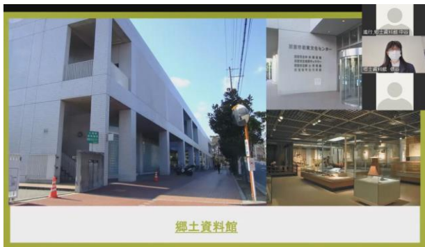
zoom ウェビナーを使用したオンラインシンポジウム（画面）

令和4年3月21日、にしのみやミュージアム活性化事業活動報告シンポジウム「にしのみやの学校博物館と学校連携」をオンライン形式で実施。シンポジウムの開催にあわせて、令和4年3月18日～27日まで、白鹿記念酒造博物館にてパネル展示を実施。