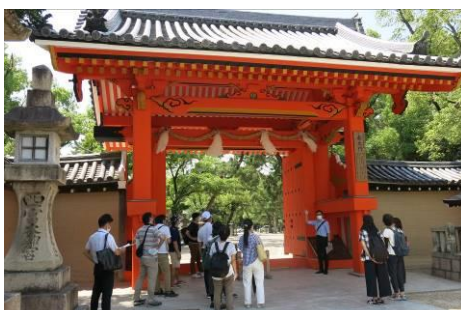
市内文化財（西宮神社）の見学