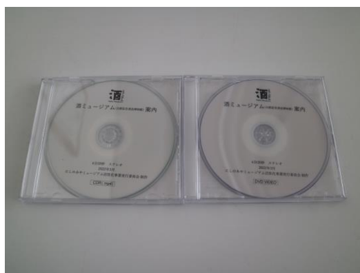
酒ミュージアム（白鹿記念酒造博物館）案内 DVD・mp4

ガイドとあわせて活用してもらうため、西宮市の伝統産業である酒づくりと、市の花でもある桜をテーマとした酒ミュージアム（公益財団法人白鹿記念酒造博物館）の案内映像を作成。