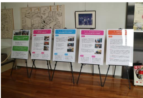
パネル展示の様子