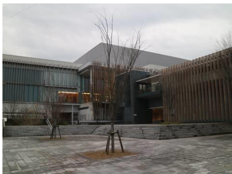
三重県総合博物館外観

令和3年12月24日、三重県総合博物館で教員向けに実施された「県総合博物館との連携講座」を視察。