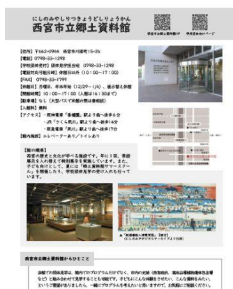
案内ガイド（市立郷土資料館案内ページ）