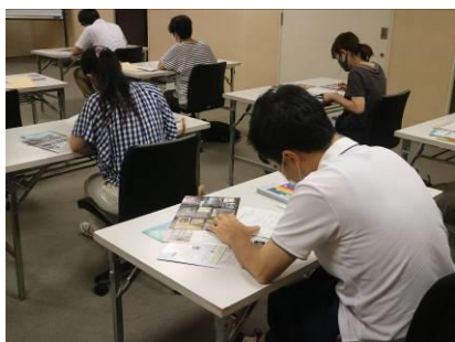
白鹿記念酒造博物館でのWS

令和3年7月30日、市内の学校教員向けに「博物館を使う、博物館で学ぶ・楽しむ」をテーマとしたワークショップを実施。