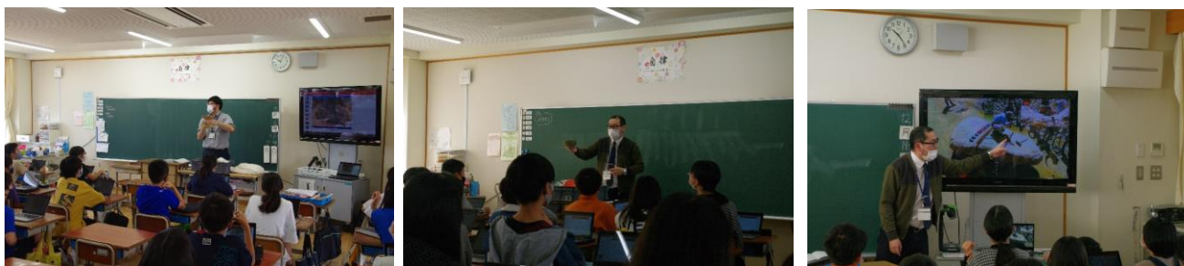
西宮市立郷土資料館学芸員による出前授業の様子

令和3年7月6日・9日、12月14日・16日、西宮市立香櫨園小学校にて出前授業を実施。