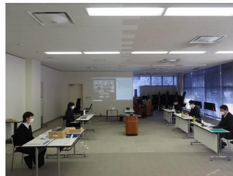
シンポジウムの様子