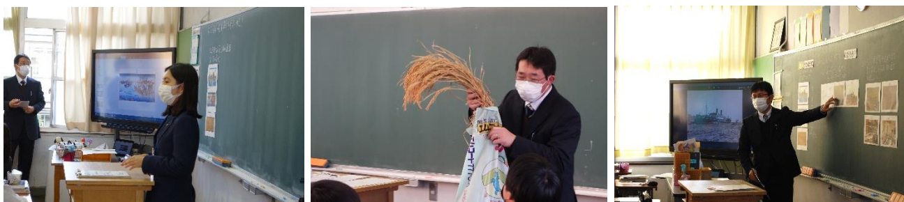
西宮市立郷土資料館学芸員・浜甲子園中学校教諭・白鹿記念酒造博物館学芸員による共働授業の様子

令和3年12月3日、西宮市立浜甲子園中学校において中学校教諭と博物館学芸員の共働授業を実施。