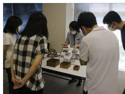
西宮市立郷土資料館でのWS