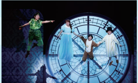
ミュージカル『ピーター・パン』(2025)