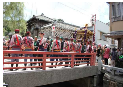
【下田八幡神社例大祭】

史跡「了仙寺」や「玉泉寺」及びその周辺地域と、開国の舞台となった湊町における下田八幡神社例大祭、日米親善と交流を広げる黒船祭等からなる歴史的風致の維持向上を図るため、伊豆石やなまこ壁造りの歴史的建造物の保存修理や、了仙寺周辺の無電柱化や道路の美装化による修復整備、祭りで使用する道具の整備・補修に関する支援等の事業等が位置づけられています。