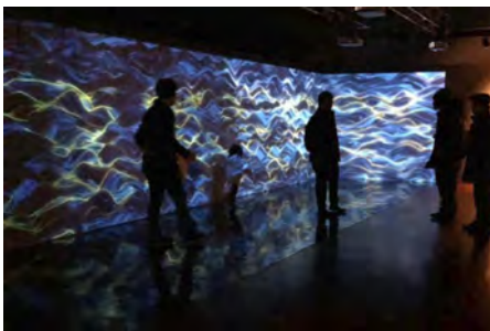
文化庁メディア芸術祭 小樽展「メディアナラティブ ～物語が生まれる港街で触れるメディア芸術」（令和元年度）

文化庁メディア芸術祭での受賞は、海外のフェスティバルへの出展や創作活動の支援等、関連事業を通じた新たな活動にもつながります。「文化庁メディア芸術祭地方展」では、受賞作品を中心に優れたメディア芸術作品を国内各地で展示・上映し、「メディア芸術海外展開事業」では、海外のメディア芸術関連のフェスティバル等で受賞作品等を紹介します。また「メディア芸術クリエイター育成支援事業」では、文化庁メディア芸術祭において受賞もしくは審査委員会推薦作品に選ばれた若手クリエイターを対象とし、新しい作品の企画を募り、制作費の支援や専門家によるアドバイスの提供等、創作活動を支援するとともに、海外の優れたクリエイターを招へいし国際交流を推進します。