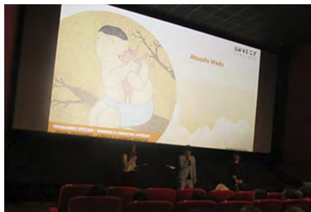
メディア芸術海外展開事業 アムシー国際アニメーション映画祭2019 公式上映