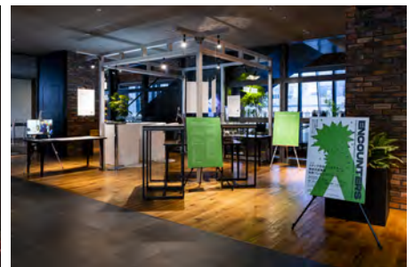
令和元年度メディア芸術クリエイター育成支援事業 成果発表イベント