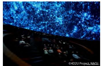
ドームシアターガイア

ドームシアターガイアは、直径15.24 m、傾斜角23°のドーム型スクリーンに、全天周映像を4Kの解像度で2D及び3Dで投影することができる球体映像システムです。