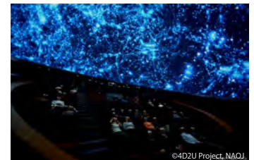
ドームシアターガイア

ドームシアターガイアは、直径15.24 m、傾斜角23°のドーム型スクリーンに、全天周映像を4Kの解像度で2D及び3Dで投影することができる球体映像システムです。