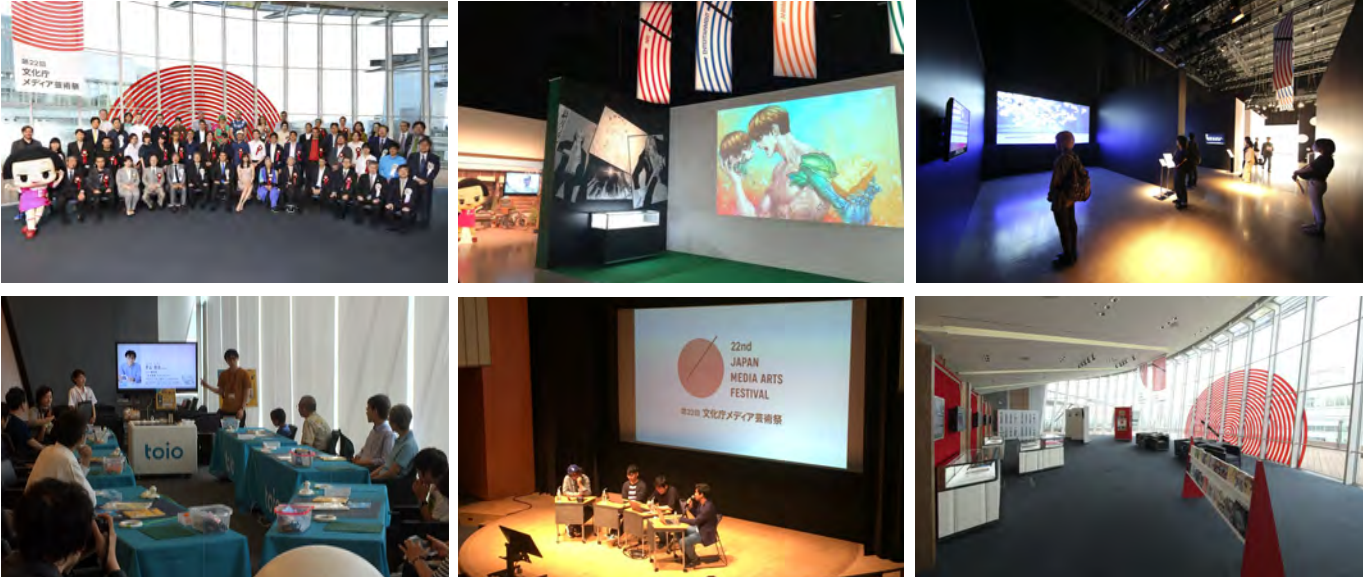
第22回文化庁メディア芸術祭 受賞作品展の様子