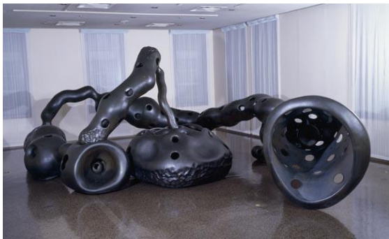
《果樹園—果実の中の木もれ陽、木もれ陽の中の果実》 1978-88年

東京の工芸館の前庭に設置されていた金工作家・橋本真之(1947-)が、10年かけて制作した《果樹園》も、移転に伴い金沢に引っ越します。