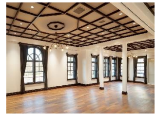
旧陸軍金沢偕行社(2F 多目的室)