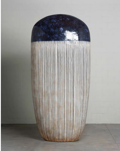
《Untitled (13-09-04)》2013年 h305.3 w141.1 d85.8 cm

新たに収蔵した、国際的に活躍する陶芸家・金子潤(1942-)の、3メートルを超える大型の作品がエントランスの中庭で皆さまをお迎えます。