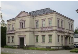
旧陸軍第九師団司令部庁舎(改修前)

明治期に建てられた二つの旧陸軍の施設、旧陸軍第九師団司令部庁舎<1898 年建築> と旧陸軍金沢偕行社<1909 年建築>(いずれも 1997 年に国登録有形文化財に登録)を移築するとともに、過去に撤去された部分や外観の色などを復元して活用しています。入口向かって左側の旧陸軍第九師団司令部庁舎は、師団司令部の執務室として、また右側の旧陸軍金沢偕行社は、陸軍将校の社交場として使われていました。展示室部分は RC 造で復元して新築し、外観は今回の移築改修に伴い判明した建築当時の色を再現しています。