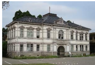
旧陸軍金沢偕行社(改修前)