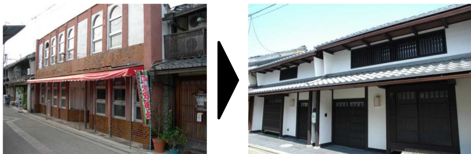
伝統的な町並みに配慮した建築物の改修の事例