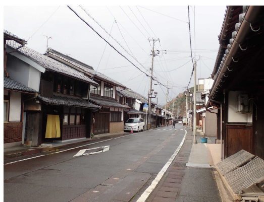
美装化を図る北国街道