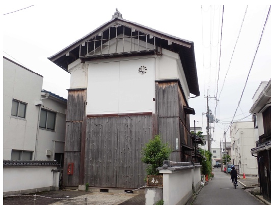
曳山を収蔵する山蔵

その上で、長浜城下町区域と北国街道木之本宿を歴史まちづくりに係る施策を一体かつ重点的に推進する区域(重点区域)として定め、長浜曳山祭の曳山を収蔵する山蔵の保存修理事業や木之本宿道路の美装化等を図る事業等を位置づけた歴史まちづくり計画(第2期)を策定し、国の認定を受けました。