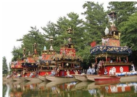
【尾張津島天王祭（朝祭）】

国指定の重要文化財「津島神社本殿・楼門」 及びその周辺地域と、600年近く続く尾張津島天 王祭、津島駅西地区の山車祭や石採祭及び 茶の湯文化が一体となって形成する、歴史的な 風情を有する良好な市街地の環境の維持向上を 図るため、津島駅西地区に所在する旧津島信用 金庫本店等の歴史的建造物の保存・活用事業や、山車等が巡行する道路の美装化、 地域の子供たちへの歴史・文化学習事業等を位置づけています。