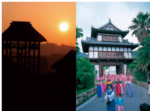
原の辻遺跡—夕景(彦岐)