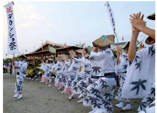
丹波篠山デカンショ祭