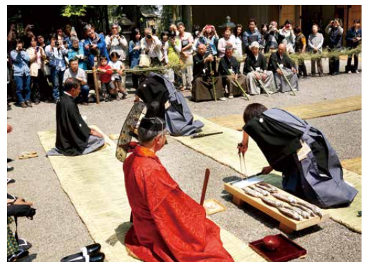
近江のケンキョ祭り・長刀振りの鮒ずし切りの神事