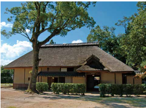
咸宜園 秋風庵 (大分県日田市)