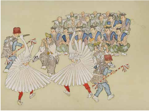
津和野百景図 第17図 祇園會鷺舞