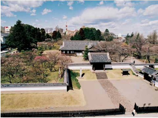
弘道館全景 (茨城県水戸市)