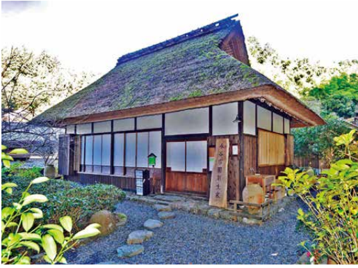
永谷宗門生家(宇治田原町)