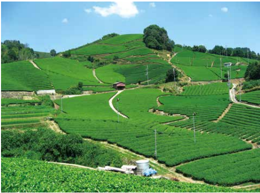
山なり茶園(和東町石寺)