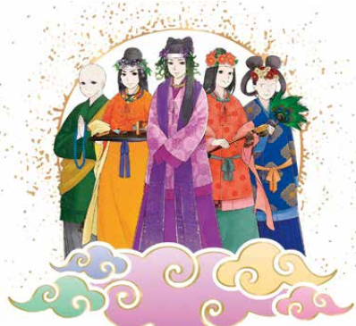
日本国創成のとき-飛鳥を翔(かけ)た女性たち- イラスト