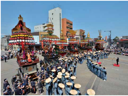
高岡御車山祭の御車山行事