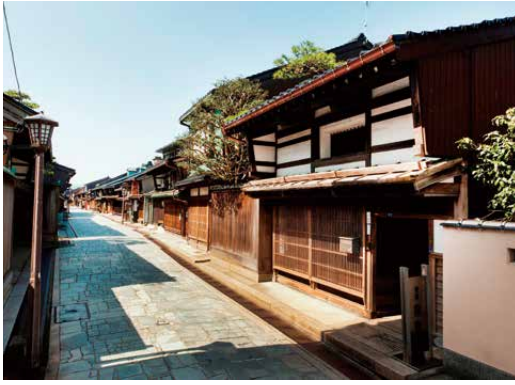
金屋町伝統的建造物群保存地区