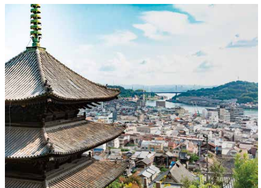
天寧寺塔婆越しに見る尾道水道