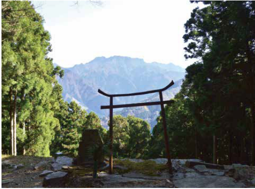
第60番札所横峰寺からの石鑑山の眺望