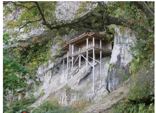
三仏寺奥院(投入堂)