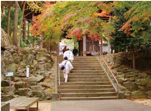
第88番札所大窪寺への参拝の風景