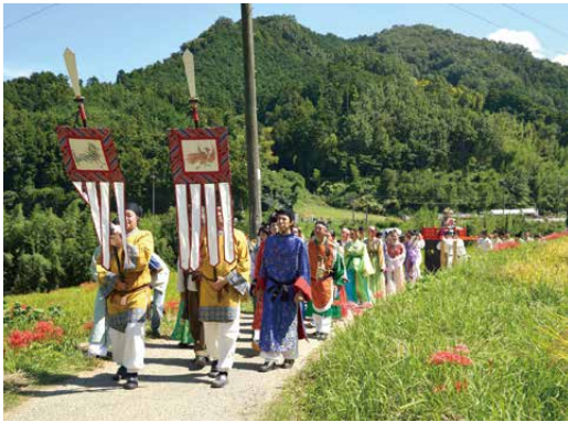
持統天皇行幸再現