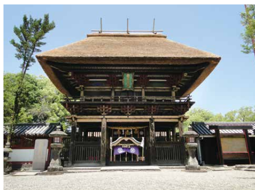
国宝青井阿蘇神社