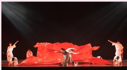
DANCE DRAMA プロモーション写真

国際障害者交流センター(ビッグ・アイ)の完全バリアフリーの環境と誰もが文化芸術活動を楽しむことができるノウハウ、障害者の国際交流ネットワークを最大限に活用し、誰もが文化芸術を楽しむことができる環境の創出と開発整備の推進をプロジェクトを通じて実現する。日本・アジアで活躍する振付家、プロのダンサーと障害のあるダンサーが協働し、わが国の自然や伝統文化等をベースにした魅力ある大型ダンスプロジェクトを実施することによって誘客力のある障害者の国際文化芸術拠点形成と共生社会の実現へとつなげる。