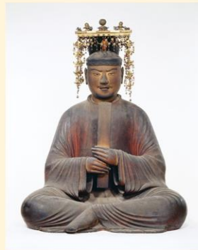
国宝 聖徳太子および侍者像のうち 聖徳太子 平安時代 保安2年(1121) 奈良・法隆寺蔵 奈良展、東京展ともに通期展示

＜奈良国立博物館＞令和3年4月27日(火)～6月20日(日) ＜東京国立博物館＞令和3年7月13日(火)～9月5日(日)