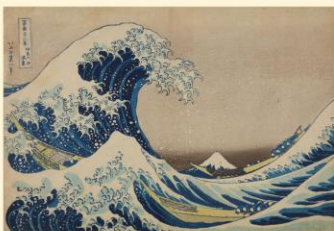
「富嶽三十六景 神奈川沖浪裏」 葛飾北斎・画 天保2～4年(1831～33)頃 東京都江戸東京博物館蔵

葛飾北斎の代表作「富嶽三十六景」全点とともに、北斎を乗り越えようとした歌川広重の作品もあわせて展示し、日本人が古くから親しみ、崇めてきた富士山をはじめとする風景画に、二人の絵師がどう挑んだのかを浮き彫りにする。