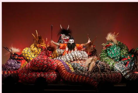
石見神楽(いわみ福祉社会芸能クラブ)

<東北ブロック:岩手県、関東・甲信ブロック:埼玉県、近畿ブロック:滋賀県> 令和3年4月1日(木)~令和4年3月31日(木)