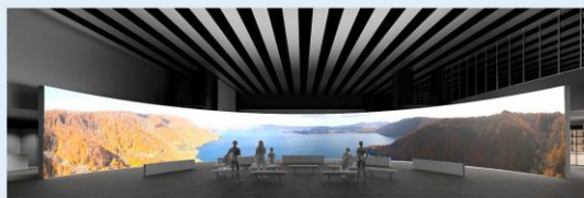
東北・新潟の魅力を発信する映像コンテンツ 「The View from TOHOKU & NIIGATA」

「感謝」、「交流」、「明日へ」の3つのコンセプトで復興支援への感謝の気持ちと東北・新潟の魅力を世界へ発信する。