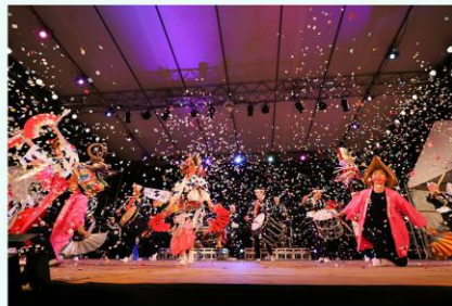
アース・セレブレーション実行委員会

本事業では、国内でも歴史ある国際野外フェスティバルが核となり「さどの島銀河芸術祭」をはじめとする「佐渡固有の文化活用事業」主体者が連携し、全島を舞台にした国際的フェスティバルを展開する。