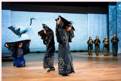
アイヌ伝統舞踊(鶴の舞)

アイヌ文化フェスティバルでは、全国からアイヌの伝承者が参集し、アイヌの伝統楽器であるムックリの演奏やアイヌの伝統舞踊を披露する。また、音楽公演として、アイヌのミュージシャンがアイヌの伝統を踏まえつつ現代音楽を取り入れて作った斬新なサウンドでアイヌ音楽の魅力を発信する。さらに、ミュージカル公演でアイヌと和人が共生できる道を探った松浦武四郎とアイヌの交わりを伝える。ステージ公演終了後、ダイジェスト版をインターネットにより配信することにより、より多くの方にアイヌ文化に触れていただく機会を提供する。