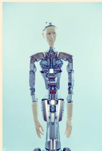
オルタ3 (Supported by mixi, inc.)

新国立劇場オペラ芸術監督・大野和士が総合プロデュース、自ら指揮し、様々なジャンルで幅広く活躍する作家・島田雅彦の台本、初音ミクオペラで海外からも注目を集める渋谷慶一郎の作曲により、これまでにない新しいオペラ作品を創出、AI(人工生命搭載アンドロイド「オルタ3」と少年の友情が自然への回帰の意識を呼び覚まし、新たな未来への扉を開く物語を展開する。