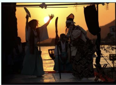
出雲神楽／大土地神楽保存会神楽方

出雲の豊かな自然・歴史・文化を活かし、中世末から近世初期にかけて確立され脈々と受け継がれてきた「出雲神楽」、数々の有形無形の文化財で構成される「日本遺産 日が沈む聖地出雲」、日本最古の歴史書に天日隅宮(あめのひすみのみや)と記された「出雲大社」、「出雲発祥とされる様々な文化(ぜんざい、日本酒など)」を4本柱とした様々なコンテンツを同時に展開し、「出雲の自然・歴史・文化」と「日本の美」を、出雲を訪れた人々にまちあるき・市内周遊を通して体感いただくとともに様々なコンテンツを映像化し、ウェブサイト・SNSを通じて国内外に広く発信していく。