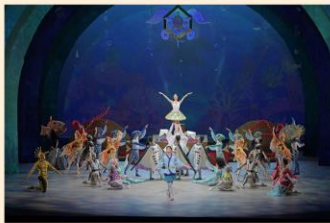
「竜宮 りゆうぐう」 第1幕より

日本の御伽草子「浦島太郎」を基とした新作バレエを新国立劇場バレエ団が令和2年7月に世界初演。竜宮城に美しい四季の部屋があることや、玉手箱を開けて老人になった太郎が鶴になり、亀姫とともに夫婦明神となり長寿を願う鶴亀伝説に繋がるなど、よく知られているおとぎ話とは一味違うストーリーが幻想的な海と空を舞台に描かれる。