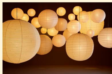
「あかり」 インスタレーション(イメージ)

20世紀を代表する芸術家イサム・ノグチ(1904-1988)の業績を振り返る展覧会。国内外から作品を集め大型彫刻を中心に約90件を展示する、ノグチの個展としては国内過去最大級の規模である。岐阜の伝統工芸である提灯づくりから想を得た「あかり」シリーズ約150灯が集まる空間を創出し、日本特有の和紙や竹の質感を生かしたやわらかな光が会場を彩るなどのインスタレーションも楽しめる。