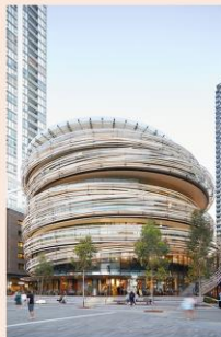
The Exchange (オーストラリア)2019 © Martin Mischkulnig

隈研吾は、日本の各時代・地方の文化的特性を巧みに組み合わせながら、その建築をつくりあげている。隈建築を知ることが日本の美意識や文化をより深く知ることに通じるという見地にたち、また日本ではまだ模型や写真が中心である建築展のレガシーとなることを目指し4Kや360度VRやプロジェクション・マッピングなど先端的な映像技術を多用したり、ポストコロナ以降の都市のあるべき姿を提示する展示を行うことを試みた。