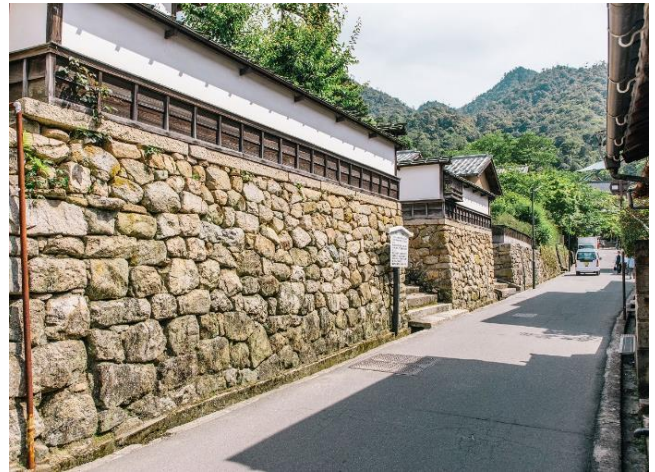
【写真2】 西町には道に面して社家住宅等の石垣や石段が連なる