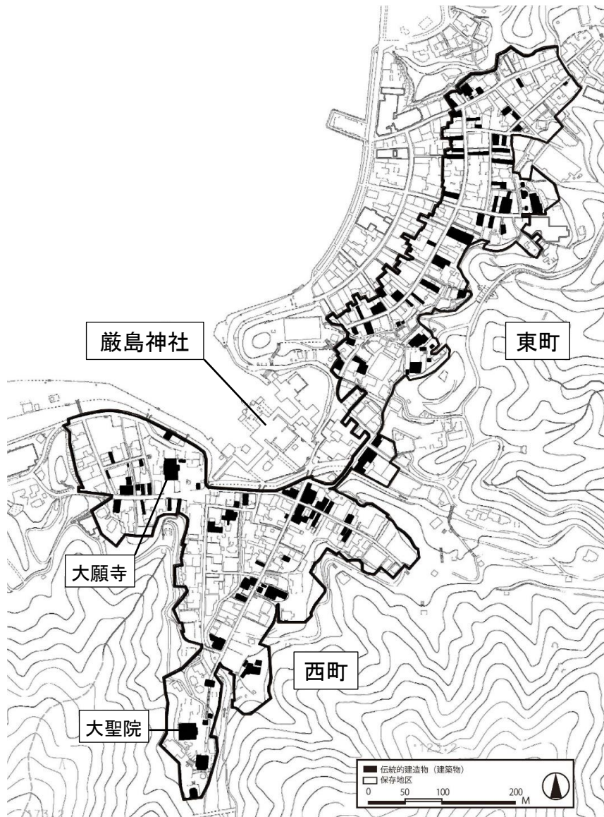
廿日市市宮島町伝統的建造物群保存地区の範囲