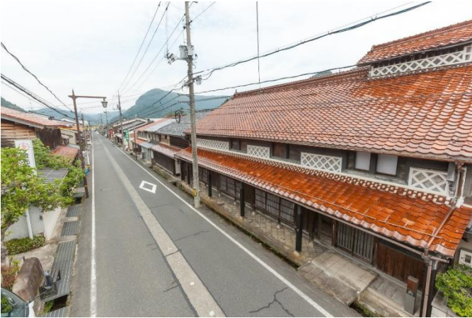
【写真1】本通りの町並み。カリヤ（庇）を設け、主屋前にはカワ（用水）が流れる。