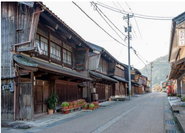
【写真1】切妻造平入で、木太い登梁と袖壁が特徴的な町家が並ぶ