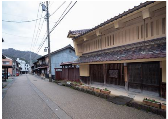
【写真2】外壁や軒裏を壁土で塗込める地区内最古の町家