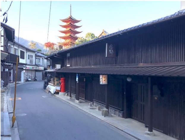
【写真1】 海岸線に平行する弓形の街路に町家が建ち並ぶ東町の町並み