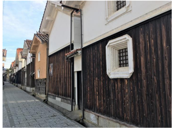
【写真2】敷地背面に建ち並ぶ土蔵群