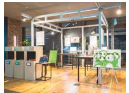
令和二年度メディア芸術クリエイター育成支援事業 成果発表イベント