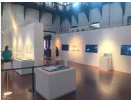
文化庁メディア芸術祭 京都展 「科学者の見つけた詩-世界を見つめる目-」（令和二年度）

文化庁メディア芸術祭での受賞は、海外のフェスティバルへの出展や創作活動の支援等、関連事業を通じた新たな活動にもつながります。「文化庁メディア芸術祭地方展」では、受賞作品を中心に優れたメディア芸術作品を国内各地で展示・上映し、「メディア芸術海外展開事業」では、海外のメディア芸術関連のフェスティバル等で受賞作品等を紹介します。また「メディア芸術クリエイター育成支援事業」では、文化庁メディア芸術祭において受賞もしくは審査委員会推薦作品に選ばれた若手クリエイターを対象とし、新しい作品の企画を募り、制作費の支援や専門家によるアドバイスの提供等、創作活動を支援するとともに、国内のキュレーター等を海外に派遣し幅広く活躍する人材を育成します。