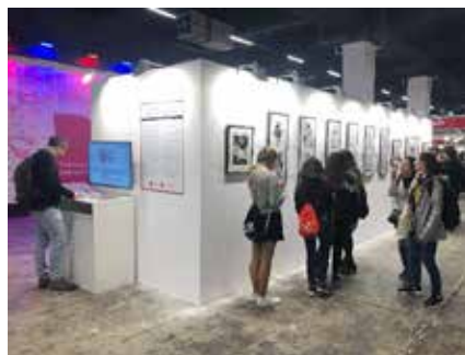
メディア芸術海外展開事業 第25回マンガ・バルセロナ 2019