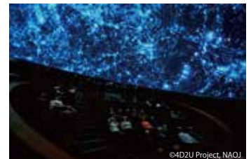
ドームシアターガイア

ドームシアターガイアは、直径15.24 m、傾斜角23°のドーム型スクリーンに、全天周映像を4Kの解像度で2D及び3Dで投影することができる球体映像システムです。