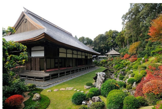
りょうたん じ ていえん 龍潭寺庭園