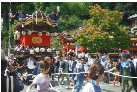
ふたまた 二俣まつり