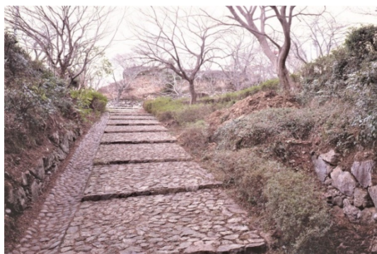
と ば やまじょうあと 鳥羽山城跡