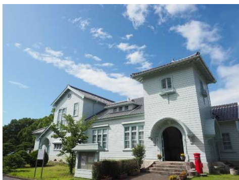
【旧日本専売公社赤穂支局（赤穂塩務局）事務所】

江戸時代、システムティックな入浜塩田による塩づくりが確立された播州赤穂。瀬戸内の穏やかな海と気候に抱かれ、千種川が中国山地からもたらした良質の砂からできた広大な干潟は、入浜塩田の開発に適していた。その製塩技術は、瀬戸内海沿岸に広がり、市場を席卷するまでに成長した。中でも赤穂の塩は、国内きってのブランドとして名を馳せ、赤穂に多彩な恵みをもたらした。このまちには瀬戸内海から生み出される塩とともに歩んできた歴史文化が蓄積され、現在に息づいている。赤穂は今なお「塩の国」なのである。