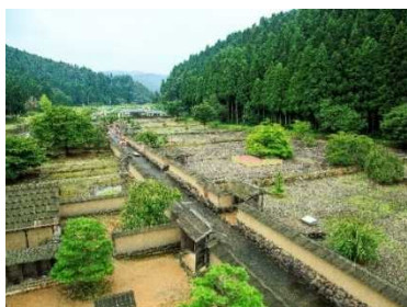
【一乗谷朝倉氏遺跡】