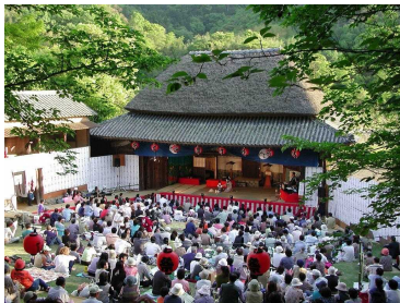
【小豆島農村歌舞伎及び舞台, 石の栈敷席】

瀬戸内備讃諸島の花崗岩と石切り技術は長きにわたり日本の建築文化を支えてきた。日本の近代化を象徴する日本銀行本店本館などの西洋建築, また古くは近世城郭の代表である大坂城の石垣など, 日本のランドマークとなる建造物が, ここから切り出された石で築かれている。島々には, 400年に渡って巨石を切り, 加工し, 海を通じて運び, 石と共に生きてきた人たちの希有な産業文化が息づいている。世紀を越えて石を切り出した丁場 ちやうば は独特の壮観な景観を形成し, 船を操り巨石を運んだ民は, 富と迷路の様な集落を遺した。今なお, 石にまつわる信仰や生活文化, 芸能が継承されている。