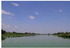
【左上：茂林寺沼及び低地湿原 右上：多々良沼，左下：城沼】