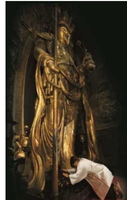
【木造十一面観音立像（長谷寺）】