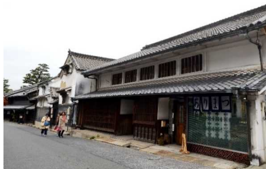
【服部幸平家住宅倉・服部良也家住宅】