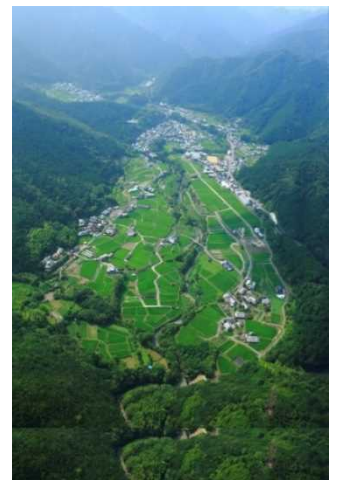
【日根荘大木の農村景観】

今から800年前、泉佐野市は上級貴族、九条家の領地「日根荘」でした。ここには二枚の荘園絵図と九条政基が書いた「旅引付」という日記が残されています。絵図には緑豊かな風景に、田畑に恵の水を注ぐため池や水路、社寺などが描かれ、日記には500年前の村の生活や人々の様子がいきいきと記されています。荘園の地を創り、中世から受け継がれてきた現在のこの風景は、絵図や日記に描かれた魅力ある農村景観へと誘ってくれるのです。