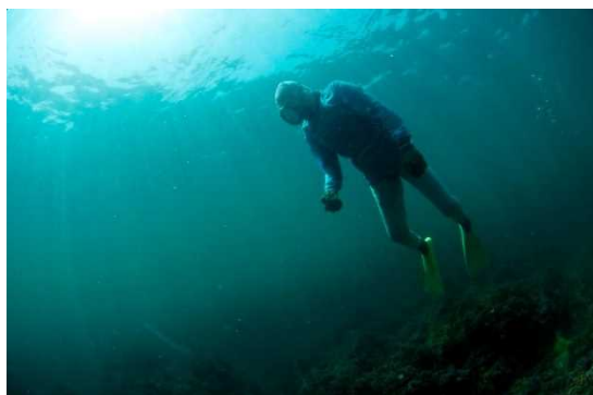
【鳥羽・志摩の海女漁の技術】

豊かな海産物に恵まれた鳥羽・志摩は、全国の約半数の海女が活躍する日本一の「海女に出逢えるまち」である。この地域で、女性が素潜りでアワビ、サザエや海藻を獲る海女漁の始まりは約 2,000 年前まで遡り、世界でも日本と韓国のみ希少な漁法である。海女が獲った海産物は伊勢神宮に「神饌（神様に捧げる供物）」として奉納され続けており、海女が中心となる祭も継承されているなど、海女ならではの風習や信仰などの「海女文化」が今も色濃く息づいている。鳥羽・志摩をめぐれば、海女文化を「五感」で体感でき、元気な海女からパワーをもらえるに違いない。