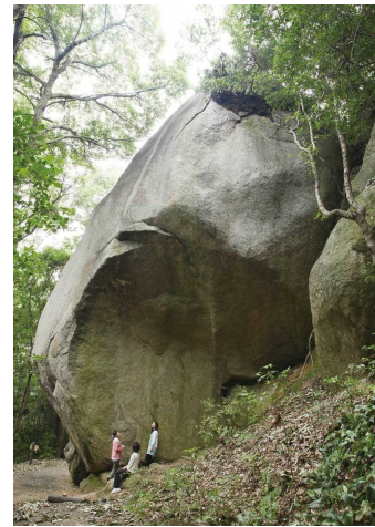
【大阪城石垣石丁場跡(天狗岩丁場)】