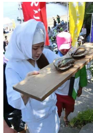
【海女の祭（しろんご祭）】