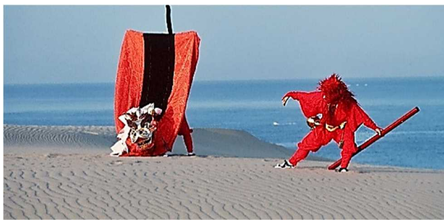
【鳥取砂丘の風紋と麒麟獅子】

人々は，厳しい風の季節での無事とそれを乗り越えた感謝を胸に，古来より幸せを呼ぶ麒麟獅子を舞い続け，麒麟に出会う旅人にも幸せを分け与えている。