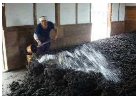
【阿波藍製造(寝せ込み)】

古くから日本人の生活に深くかかわり, 神秘的なブルーといわれた「藍」。徳島県の北部を雄大に流れる吉野川の流域は, 藍染料の日本一の産地です。この地域の平野部に見られる高い石垣と白壁の建物に囲まれた豪農屋敷や脇町の豪華な「うだつ」があがる町並み, 「阿波おどり」のリズムからは藍染料の流通を担い, 全国を雄飛した藍商人のかつての栄華をうかがい知ることができます。この地域では, 今も藍染料が伝統的な技法で生み出されており, その色彩は人々を魅了し続けています。