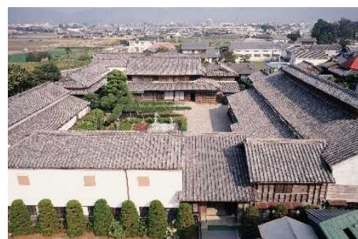
【「城構え」といわれる藍屋敷(奥村家住宅)】