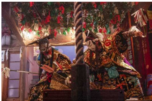
【神社での奉納神楽】

島根県西部，石見地域一円に根付く神楽は，地域の伝統芸能でありながらも，時代の変化を受容し発展を続けてきた。その厳かさと華やかさは，人の心を惹きつけて離さない。神へささげる神楽を大切にしながら，現在は地域のイベントなどでも年間を通じて盛んに舞われ，週末になればどこからか神楽囃子が聞こえてくる。老若男女，観る者を魅了する石見地域の神楽。それは古来より地域とともに歩み発展してきた，石見人が世界に誇る宝なのだ。