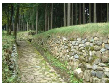
【白山平泉寺旧境内】