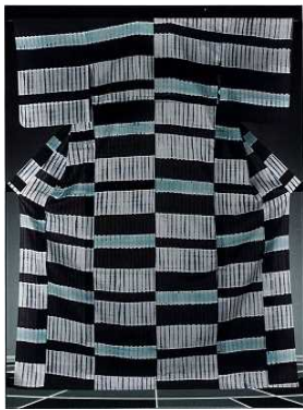
【絞り浴衣本藍染鎧段】