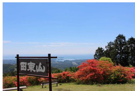
【田東山山頂から三陸を望む】