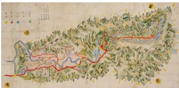
【犬鳴山七宝瀧寺並びに大木村絵図】