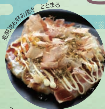
ととまる 高岡流お好み焼き