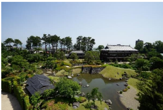
りんこうかく にほんていえん 臨江閣と日本庭園

本計画では、市内に残る歴史的建造物の保存活用・未指定建造物の調査に関する事業や、歴史情緒をさらに高めるための道路高質化・環境整備、まち並みのアクセントとなる歴史性を象徴する建造物等の復元・集客施設の整備等を位置付け、歴史的風致の維持及び向上を図っていくこととしています。