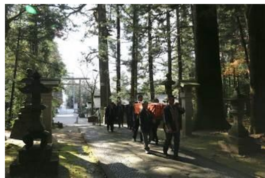
にのみやあかぎじんじゃ ごじんこう 二宮赤城神社の御神幸