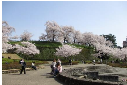
まえばしこうえん はなみ 前橋公園の花見