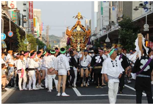
しんしゅううえだぎおんさい 信州上田祇園祭

本計画では、市内に残る歴史的建造物の保存・活用に関する事業や道路の 美装化、歴史文化を活かした観光振興事業等を位置付け、歴史的風致の維持 及び向上を図っていくこととしています。