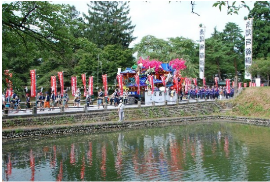
しんじょうじょうし 新庄城址と新庄まつり

本計画では、市内に残る歴史的建造物の保存活用に関する事業や、その周辺の環境整備に関する事業のほか、地域におけるまつりや伝統行事などの担い手の育成・確保や、学校教育、社会教育を通じた歴史的風致の認識向上、地域資源や歴史文化を活用した観光振興に関する事業等を歴史的風致の維持及び向上に資する事業と位置付け、歴史まちづくりを推進していくこととしています。