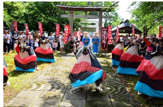
はぎの に た や ま し し おど り 萩野・仁田山鹿子踊