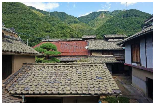
佐藤家住宅（三ツ引）