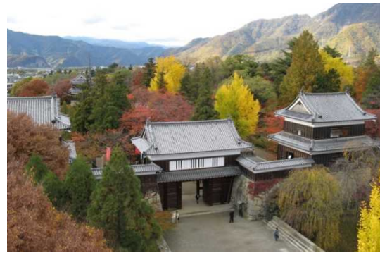
うえだじょうあと 上田城跡