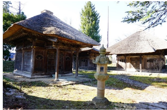
しんじょうはんしゅとざわけほしよ 新庄藩主戸沢家墓所