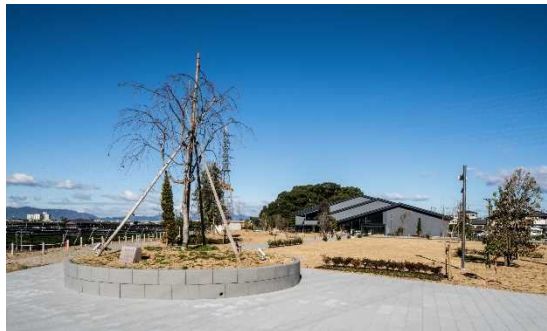
お茶と宇治のまち歴史公園