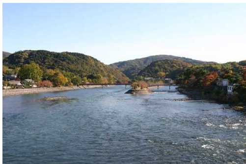
宇治橋から宇治川上流を望む

第1期計画では、お茶と宇治のまち歴史公園(情報発信・観光交流施設及び史跡)の整備を実施し、令和3年8月に開園しました。その他、重要文化的景観保存事業などを実施し、まちづくり活動の活性化や宇治茶ブランドの価値の向上、探究的な学習の充実などの成果が得られました。