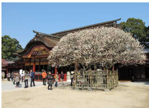
太宰府天満宮本殿(重要文化財)と飛梅 とびうめ