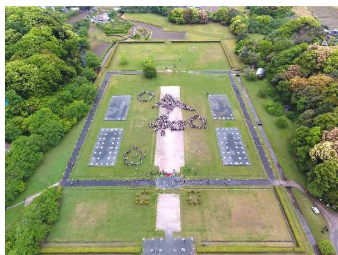
「令和」の人文字プロジェクトが行われた 大宰府跡(特別史跡) ださいふあと