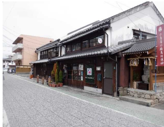
6 小鳥居小路の恵比寿像と 歴史的風致形成建造物 ことりいしょうじ