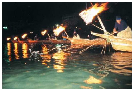
ぎふ長良川の鶺鴒