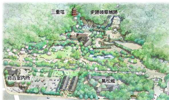
岐阜公園再整備イメージ