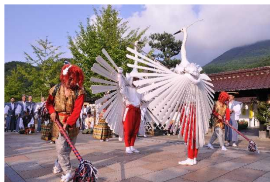
とうやまえ 頭屋前(町民センター)で舞う鷲舞神事