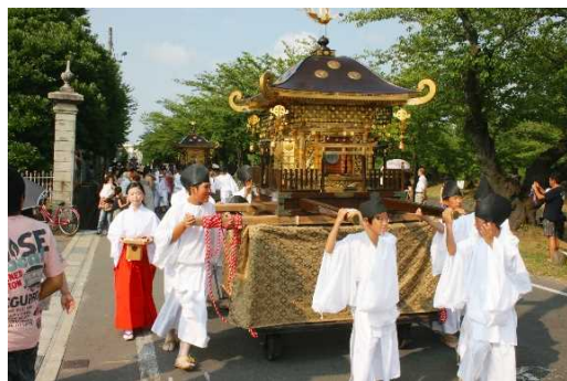
鶴ヶ岡城下町地区 庄内大祭の大名行列

第2期計画では、第1期計画の評価と検証を行うとともに、引き続き、公共施設等の修景整備や支援、協議会の活動助成等による歴史的建造物の保存と活用を図るほか、歴史的・文化的資源を活かした歴史と魅力あるまちづくりの推進、豊かな自然、歴史、文化、景観を背景とした固有の歴史的風致の維持向上を図り、市民の歴史まちづくりへの理解醸成と国内外に向けた魅力発信をまいります。