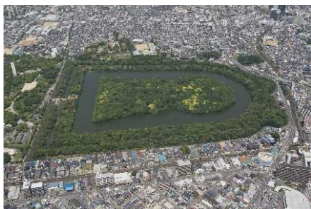
百舌鳥古墳群(仁徳天皇陵古墳および周辺) (世界遺産構成資産・一部史跡)