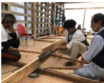
舟大工の育成(鶺鴒舟の造船)

第2期計画では、伝統的な活動の担い手不足などの課題に取り組むほか、第1期計画で進めた整備についても、市民の誇りにつながる本物志向の観光まちづくりに取り組んでいきます。