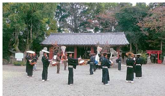
桜井神社拝殿(国宝)と上神谷のこおどり