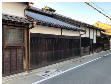
井上関右衛門家住宅(鉄砲鍛冶屋敷) (市指定有形文化財)