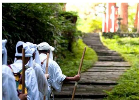
羽黒手向地区と出羽三山参り