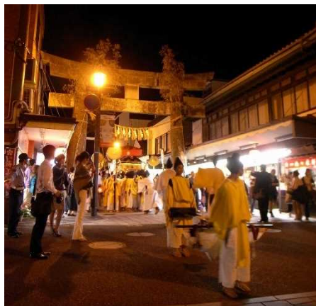
太宰府天満宮参道を通る 神幸式の行列 じんこうしき

第2期計画では、引き続き、歴史的建造物の保存修理やその他の建造物の修景のほか「さいふまいり」の名所地や散策路、文化遺産周辺の環境整備を推進することで、各エリアの個性や魅力を向上させ、歴史的風致の維持及び向上を図っていきます。このことにより太宰府天満宮参道一極集中となっている来訪者の回遊性をさらに高め、滞在時間の延長に繋がります。