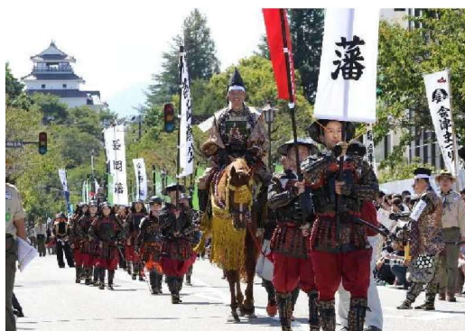
あいづ 会津まつり

本計画では、市内に残る歴史的建造物や歴史のまちを象徴する街なみ及び文化財の保存・活用に関する事業や伝統行事や伝統技術等の文化の保存・継承に関する事業等を位置付け、歴史的風致の維持及び向上を図っていくこととしています。