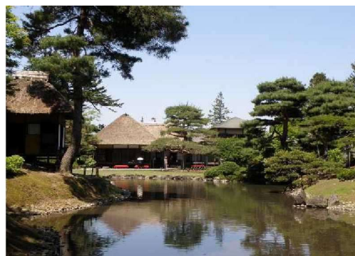
あいづ まつだいら し ていえん 会津松平氏庭園