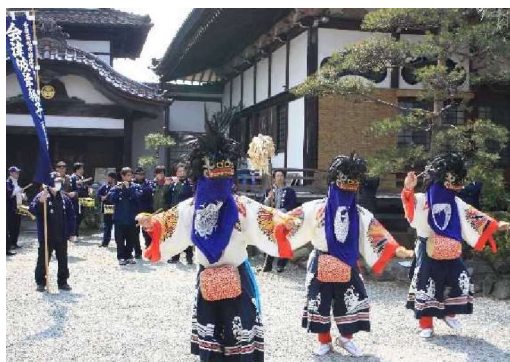
ひ がん じ し 彼岸獅子