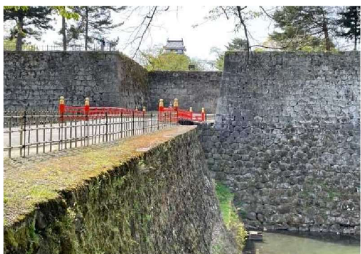
わかまつじょうあと 若松城跡