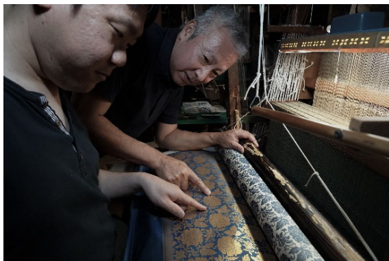
ひょうそうぎれせいさく (表装裂製作)