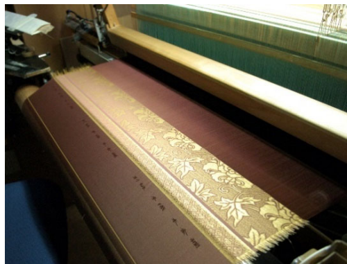
せいしよく きんらん (製織中の金欄)