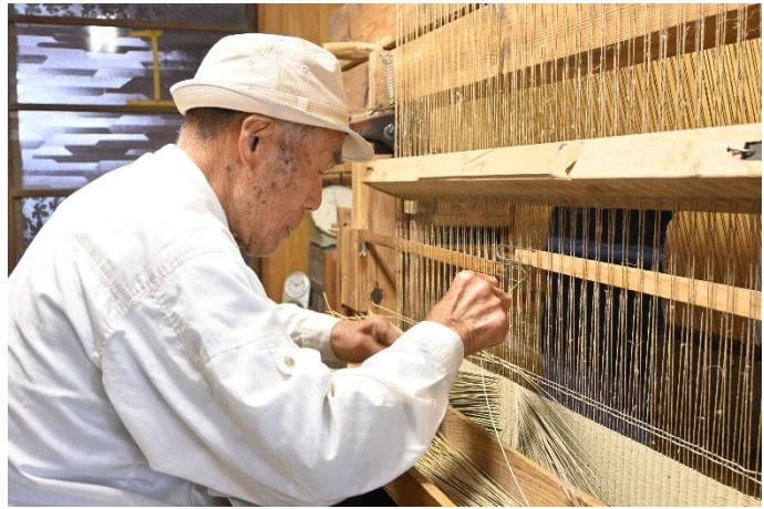
(織機で藺草を織り込む)