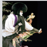
「奥州安達原」安倍貞任・安倍宗任

出演：豊竹呂太夫 鶴澤清治 吉田和生 ほか 料金：1 等 5,500 円 (学生 3,900 円) / 2 等 3,800 円 [10/8 発売] 制作：独立行政法人日本芸術文化振興会