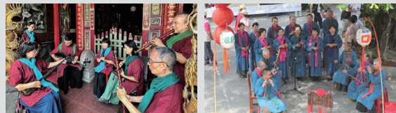
タイナンシンセイシャ マードウシャンコウジューインシャ