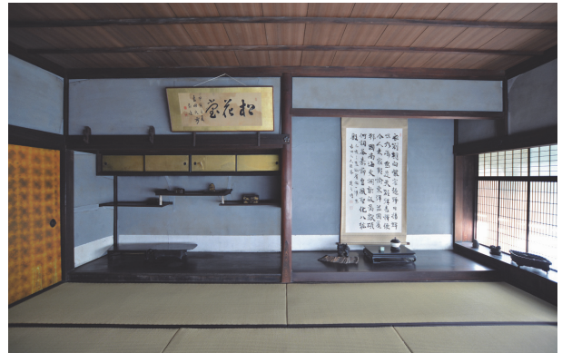
十五畳広間