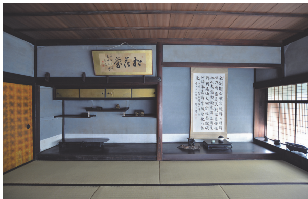
十五畳広間

吉田松花堂は伝統薬の製造・販売を家業とする商家で、熊本城下の市街地に大規模な敷地を占める。医学を修めた初代吉田順碩が開発した「諸毒消丸」は、日常の携行薬、熊本の名産品として広く普及し、富の蓄積により敷地の拡張を進め、建物を増改築して、明治末期頃に広大な邸宅をなすに至った。伝統薬の店舗・製薬場である主屋は明治11年建築で、通りに面して鼠漆喰塗りの重厚な構えを見せる。主屋は、造付けの薬棚や旧製薬場、イッカクの角を用いた違棚など家業にまつわる設えが独特で、中国風意匠の二階座敷、華やかな杉戸絵など意匠的にも優れている。同時期建築の土蔵とともに近代の製薬・売薬を営む商家の構えを遺す。賓客の宿泊施設にもなった端正な広間の十五畳、材の取り合わせが華やかな茶室などを含め、意匠の優れた近代和風建築群として価値が高い。