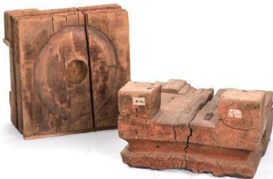
左：附・古材（大斗）、右：附・古材（雲形組物）