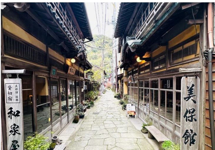
写真2 石敷の本通り沿いに建ち並ぶ町家や旅館建築

保存地区は三方を山が囲み、弓なりの湾岸の狭い土地に細い路地で構成された近世由来の街区と敷地の区画が良く残り、江戸時代から昭和30年代までの町家や大規模な近代の旅館が一体となって、港に広がる門前町としての歴史的な風致を形成する。