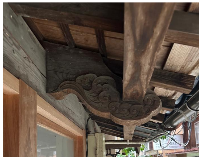
写真3 彫刻を付した装飾的な腕木