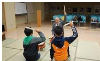
金沢能楽美術館 体験（能面・能装束の着装、能楽器）