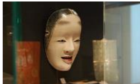
金沢能楽美術館 2F 展示室