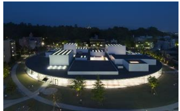
金沢21世紀美術館 外観（夜間）