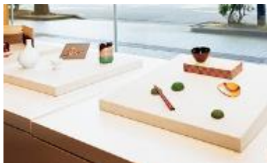
金沢能楽美術館 1F エントランス 「工芸の風姿花伝」工芸作品の展示販売