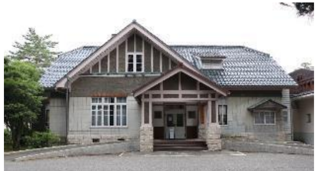
広坂別館（旧陸軍第九師団司令部長官舎） 外観