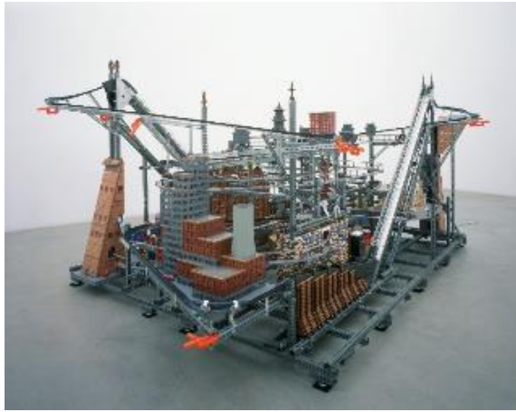
クリス・バーデン《メトロポリス》2004年 金沢21世紀美術館蔵