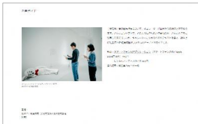
オリジナルオーディオガイド