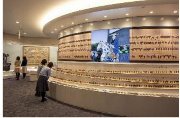
大名行列に関する展示