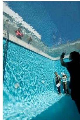
レアンドロ・エルリッヒ《スイミング・プール》2004年