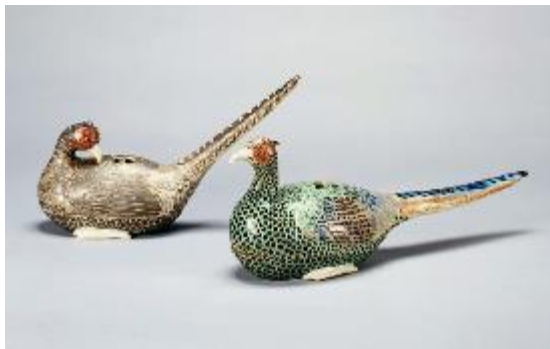
右：国宝「色絵雉香炉」野々村仁清作 左：重要文化財「色絵雌雉香炉」野々村仁清作

国登録有形文化財「旧陸軍第九師団司令部長官舎」を活用した広坂別館は、ギャラリー等、県民の文化活動の場として利用されており、貴重な近代建築を自由に見学することができる。広坂別館に併設された石川県文化財保存修復工房では、文化財の修復についてわかりやすく解説するほか、文化財の修復の様子を常時公開している。