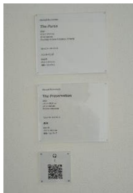
QRコード利用した作品の紹介

展示室内には、QRコードを利用して作品の紹介や音声案内 (一部) を行い、一部展覧会においては、オリジナルオーディオガイド (ネット決済・有料) による音声案内を行っている。