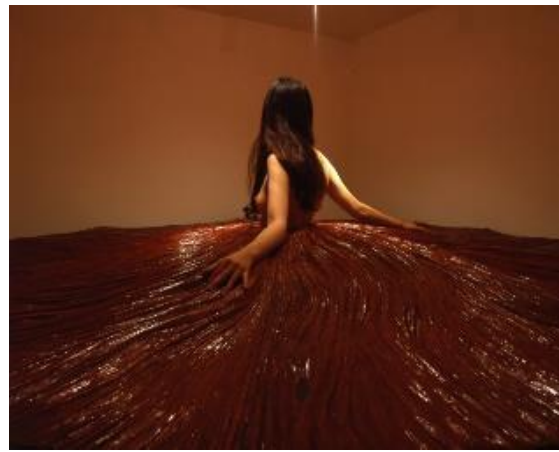
小谷元彦《ドレイプ》1998年 金沢21世紀美術館蔵