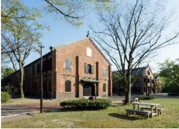
県立歴史博物館 外観