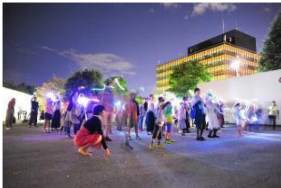
みんなでPIKAPIKA スペシャルワークショップ

観光客に長く金沢での観光を楽しんでもらうため、地域の夜の魅力を創出する。金沢21世紀美術館を含め、市内の観光地をライトアップすることで、夜の回遊を促すとともに、夜間開館やコンサート等の夜間イベントを開催し、特別な夜のミュージアムを体験してもらう。