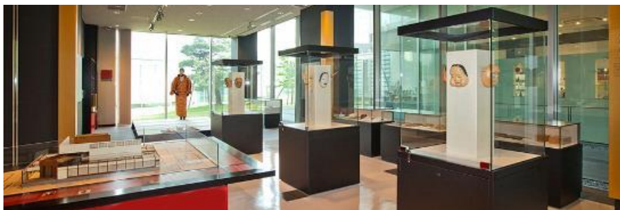
金沢能楽美術館 1F 導入展示