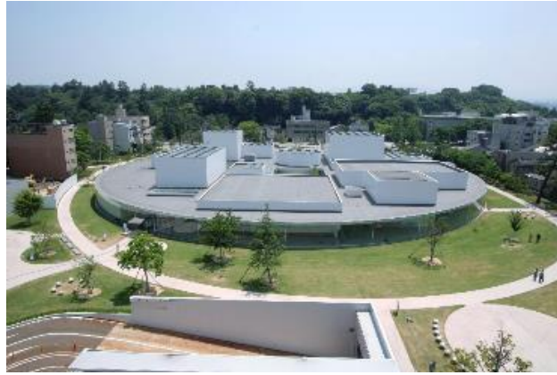
金沢 21 世紀美術館 外観