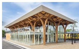
由布市ツーリストインフォメーションセンター