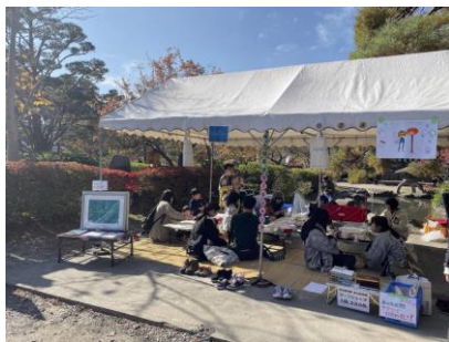
「善光寺びんずる市」への参加