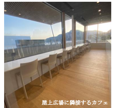
屋上広場に隣接するカフェ