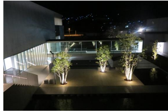
ライトアップされた水辺テラス