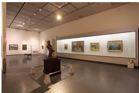
飯田市美術博物館における交流展