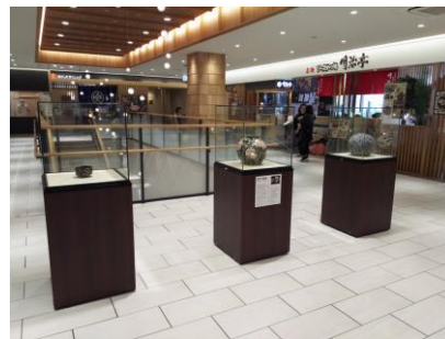
長野駅ステーションビル「MIDORI」における作品展示