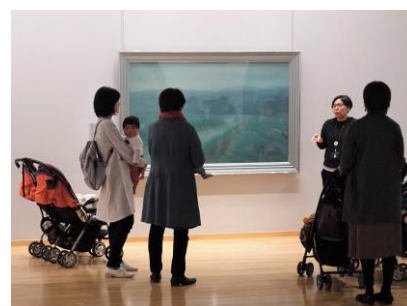
ベビーカートツアー