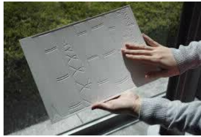
さわるコレクション(京都国立近代美術館)