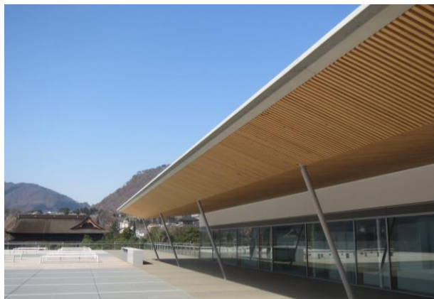
長野県産ヒノキの大 庇軒下ルーバーが特長的な 屋上広場「風テラス」(奥は善光寺)