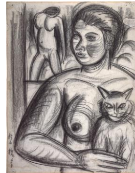
村山槐多《猫を抱ける裸婦》