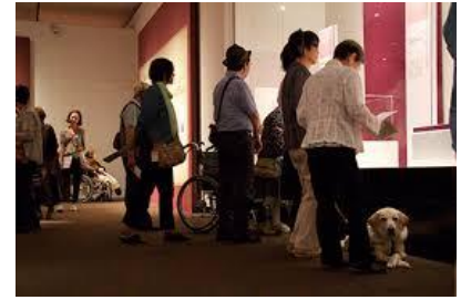
障害のある方のための特別鑑賞会 (東京都美術館)

※そのほか「アート・コミュニケータ(人とアートのつなぎ手)」による対話型鑑賞を予定(本計画外)