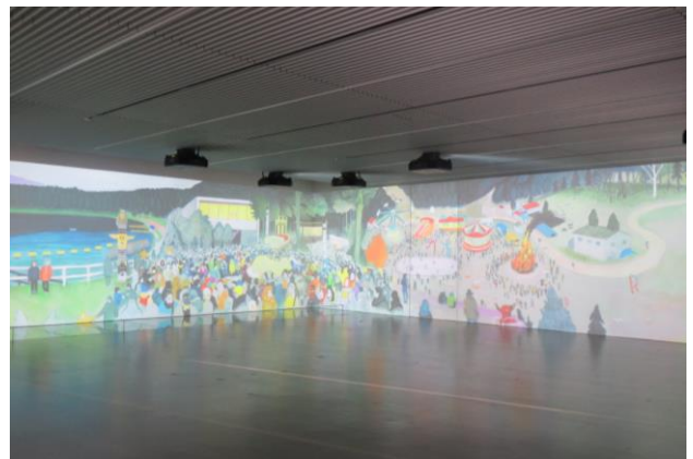
27mに渡るL字型大壁面に映像アートが流れる交流スペース (イメージ)

今後の来館者の国内（県外）のターゲットとしては、従来からも大きな割合を占めていた関東地方はもとより、高速交通網の整備を活かし、関西方面や北陸新幹線の沿線となる北陸方面もターゲットとして強化していく。（この拠点計画期間中には、北陸新幹線は敦賀（福井県）まで延伸される予定。）