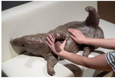
中ハンクシゲ《ゴロゴロ犬》(2018)