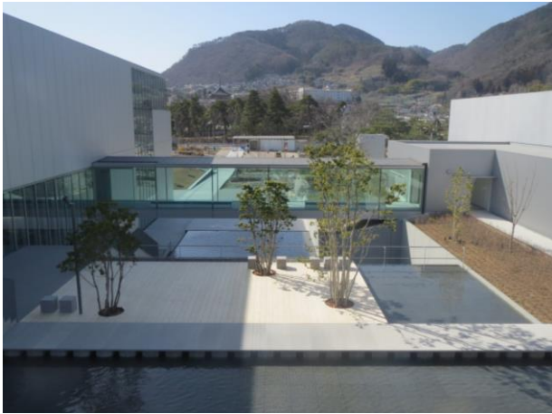
カスケード（水景）が広がる水辺テラス