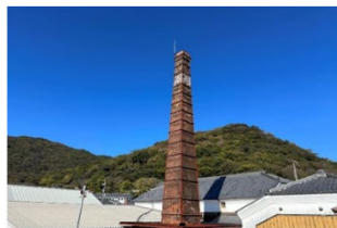
龍野地区のランドマーク