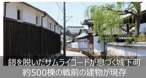
鎧を脱いだサムライコードが息づく城下町 約500棟の戦前の建物が現存

景観形成地区: たつの市龍野地区, たつの市龍野伝統的建造物群保存地区 (歴史的建造物, 伝統的建造物群保存地区)