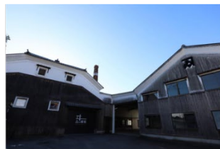
旧カネヅ醤油工場群の外観 : ゐ蔵