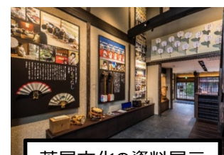
茶屋文化の資料展示