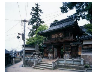
金沢卯辰山麓重要伝統的建造物群保存地区 (国指定)