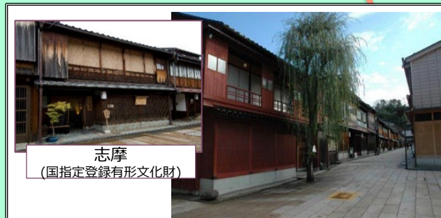
志摩 (国指定登録有形文化財)