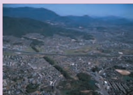
水城跡・大野城跡

さいふまいの立寄り所である水城跡・大野城跡の修理・整備を行うことで「さいふまいりにおける歴史的風致」の維持向上を図ります。