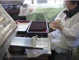
店先での梅ヶ枝餅丸め

天満宮の門前には、江戸時代から続く歴史的建造物が残り、名物となっている梅ヶ枝餅を始め参詣者をもてなす生業が続いています。また、恵比寿まつりや県指定無形文化財指定の鬼すべなどが伝統的生活として受け継がれています。