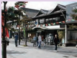
参道の歴史的建造物

天満宮門前の伝統家屋や市内に点在する歴史的建造物など太宰府の歴史的風致を形成している建造物の修理に助成を行い、良好な景観の形成と歴史的風致の維持向上を図ります。