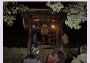
大晦日の観世音寺鐘楼

観世音寺の除夜の鐘は寒い中人々が静かに集まり、国宝に指定されている梵鐘をひと打ちつつ撞いていく行事です。古代の音色が観世音寺など歴史的建造物の間に響きます。