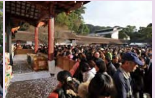
初詣で賑わう本殿前