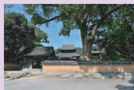
戒壇院の山門と土塀

趣きのあるたたずまいで来訪者の目に触れる戒壇院の山門、土塀、東門の保存修理を行うことで歴史的風致の維持及び向上を図ります。